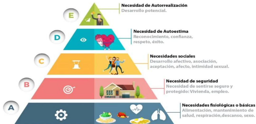
Figura 1. Pirámide de las Necesidades de Maslow. Comida que Sana. Psicología (2018)

La finalidad de esta teoría era lograr que las personas desarrollaran su máximo potencial. En esta teoría se argumenta que los intereses de las personas ascienden desde una base piramidal en la que se encuentran los impulsos básicos, denominados de déficit, los cuales una vez han sido satisfechos, asciende a los siguientes niveles de la pirámide los cuales engloban las motivaciones secundarias, específicamente humanas, las cuales van desde las necesidades de seguridad, pertenencia, amor y estimación. Una vez satisfechas todas estas necesidades de forma escalonada ascendente, se puede decir que la persona se encuentra en el vértice de la pirámide, es decir en la autorrealización.