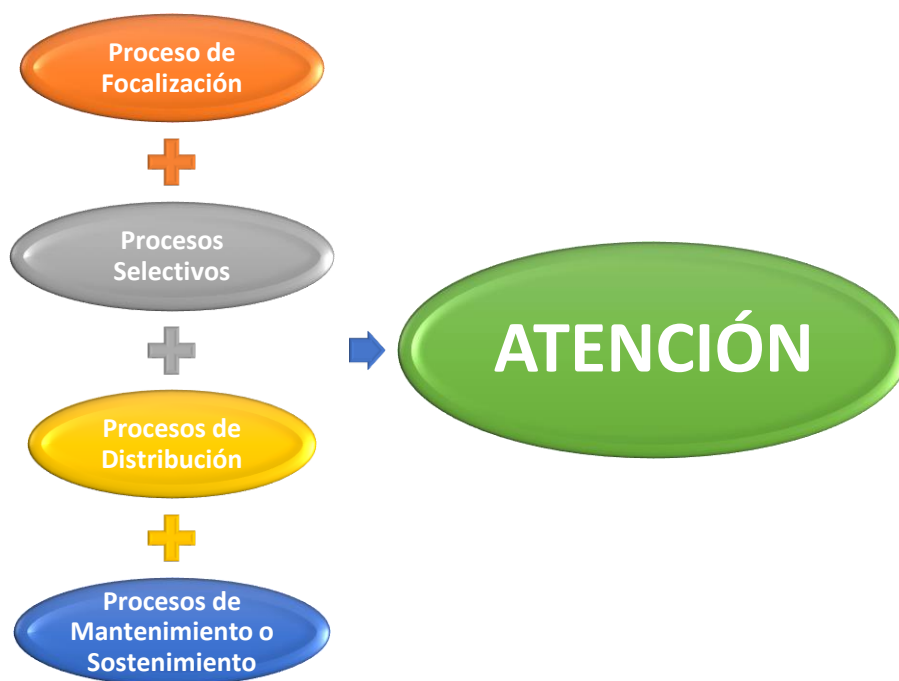
Figura 3. Procesos Mentales Relacionados con la Atención. Elaboración Propia (2020)

A continuación, en el gráfico 3, se muestran estos procesos: