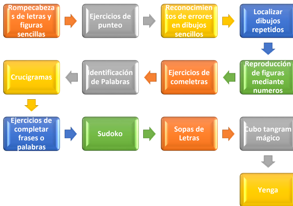
Figure 4. Juegos Recomendados para Activar la Atención y Concentración. Elaboración Propia (2020)

activación de la concentración en los niños, dentro de estos juegos se tienen los que se mencionan a continuación en la figura 4.