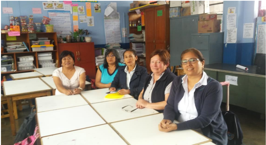
Maestras del tercer ciclo en reunión de coordinación con el directivo.