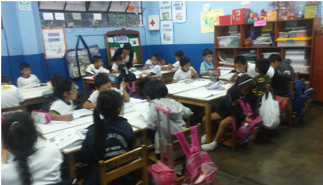
Directivo realizando acciones de acompañamiento a los estudiantes de segundo grado.