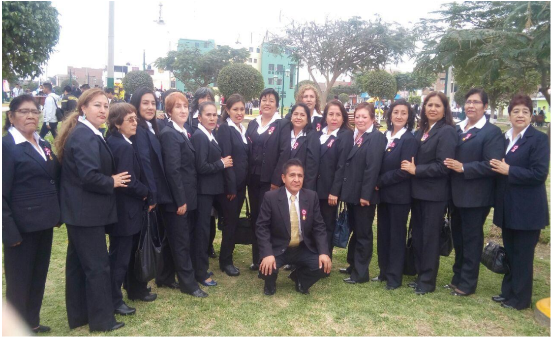
Personal directivo, docente y administrativo de la I. E: 80039 “Miguel Grau Seminario”