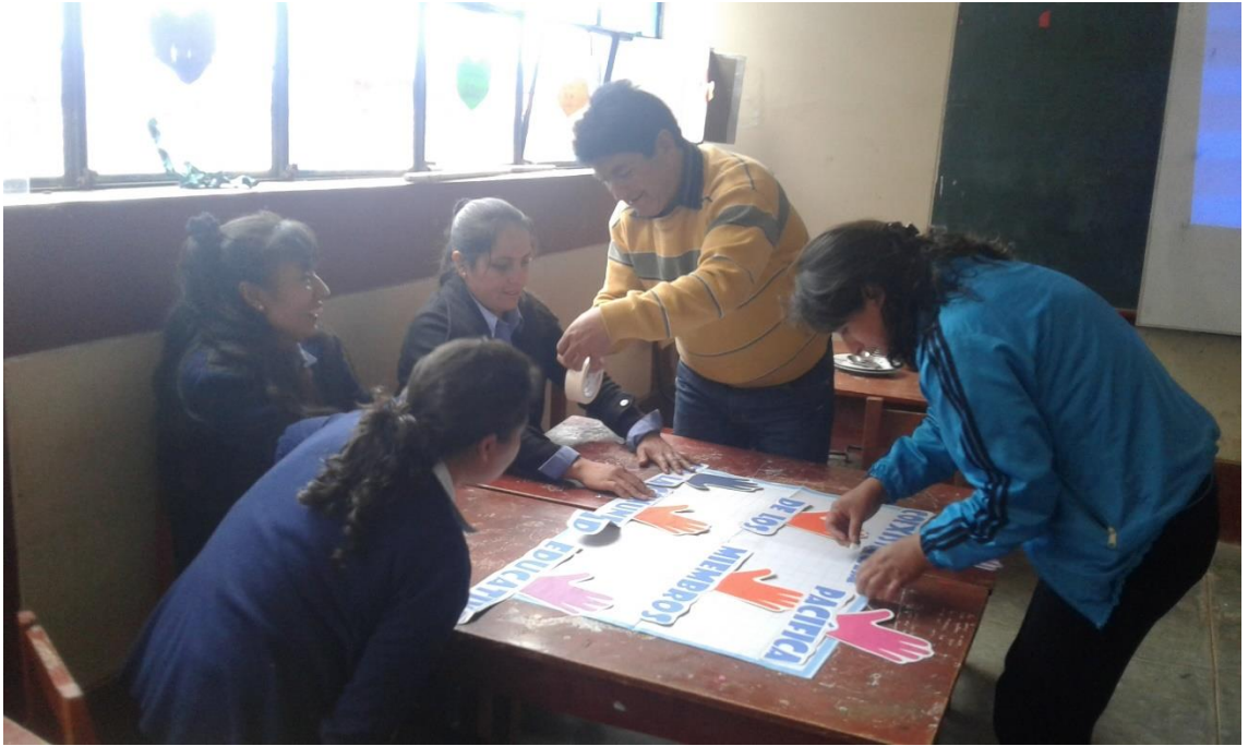
Directivo y docentes de la I.E. N° 80480 en taller de trabajo sobre convivencia