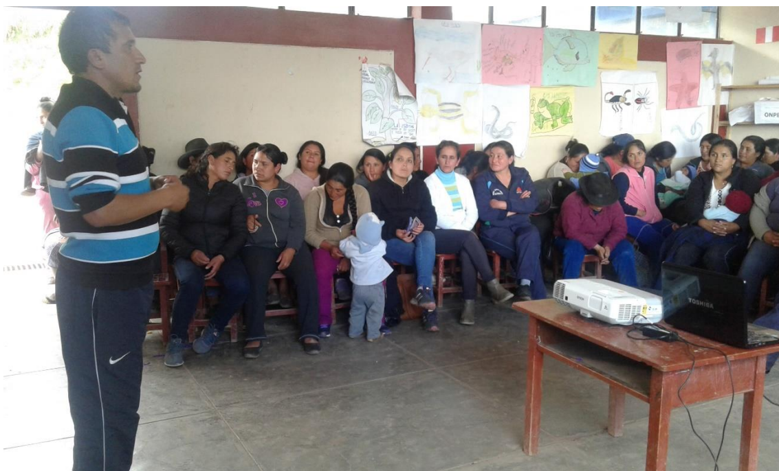
Docente líder de la I.E. N° 80480 sensibilizando a docentes y padres de familia en reunión.