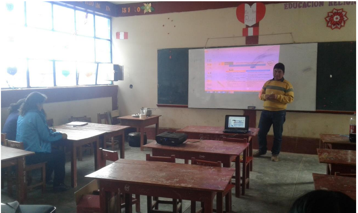
Directivo de la I.E. N° 80480 compartiendo tema sobre la convivencia en la escuela