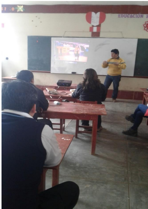
Directivo y docentes de la I.E. N° 80480 se empoderan del Currículo Nacional