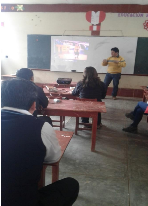
Directivo de la I.E. N° 80480 socializando el Currículo Nacional de Educación Básica.