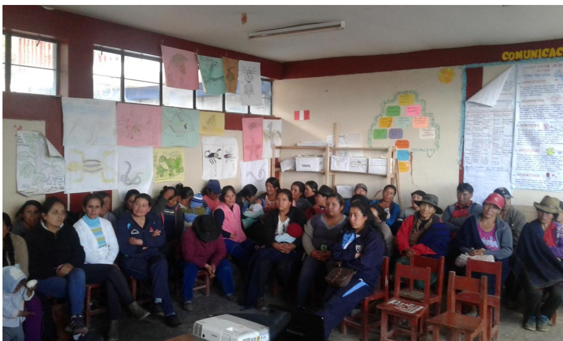
Directivo compartiendo el proyecto de aprendizaje en reunión con docentes y padres de familia