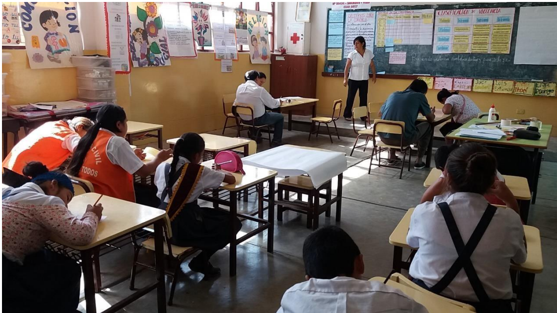
Docentes, estudiantes y padres de familia elaborando situaciones que influyen en el logro de los aprendizajes de nuestra Institución Educativa.