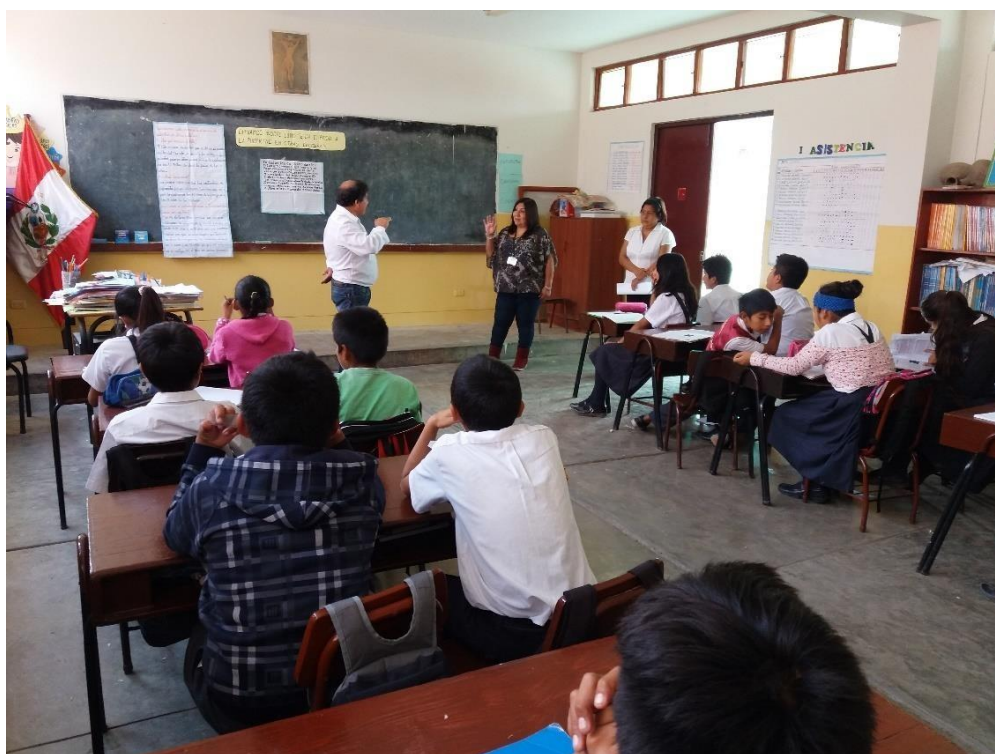
Durante la visita de monitoreo formadora visitando una aula del V ciclo de Primaria.