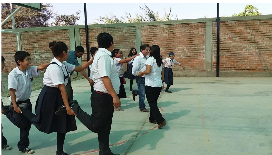
Docentes, alumnos y padres de familia socializando una dinámica.