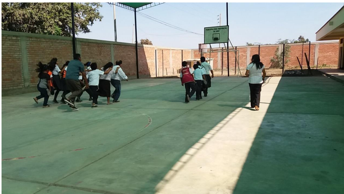
Familia educativa volviendo a ser estudiantes realizando una dinámica para lograr su objetivo