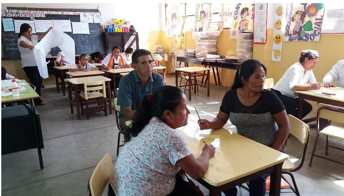
Durante la socialización de la problemática juntos padres de familia, docentes y estudiantes.