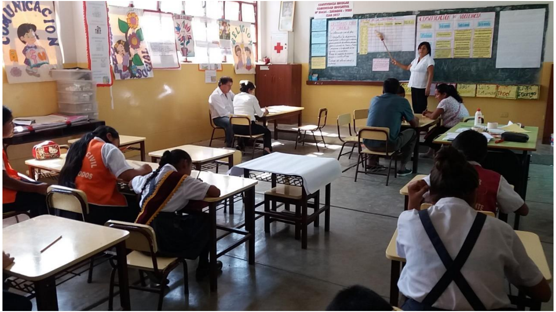
Directora explicando sobre la Matriz de la Convivencia en su Institución Educativa.