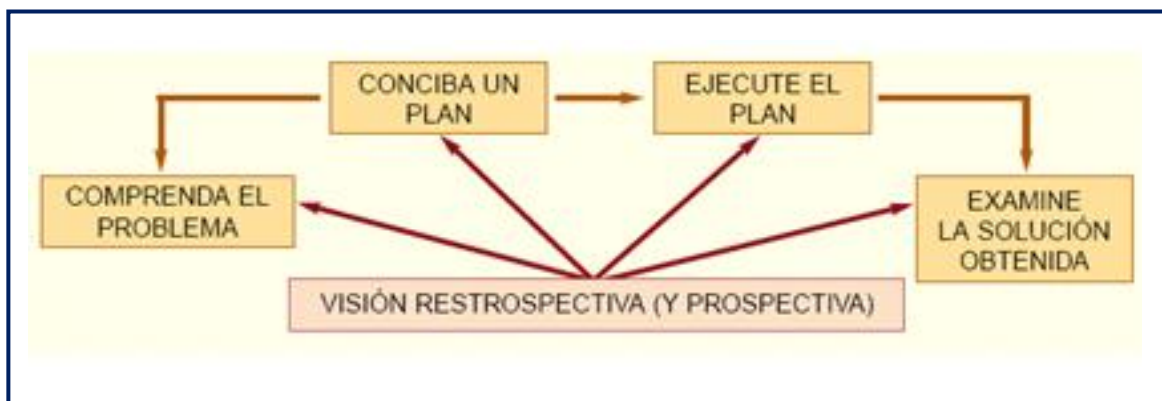
Figura 4. Estrategia metodológica para resolver problemas Según George Polya.

- Examine la solución obtenida. Realiza una revisión del proceso, es decir los tres pasos anteriores y escribe el resultado. Respuesta: Juan ha recorrido 168 km.