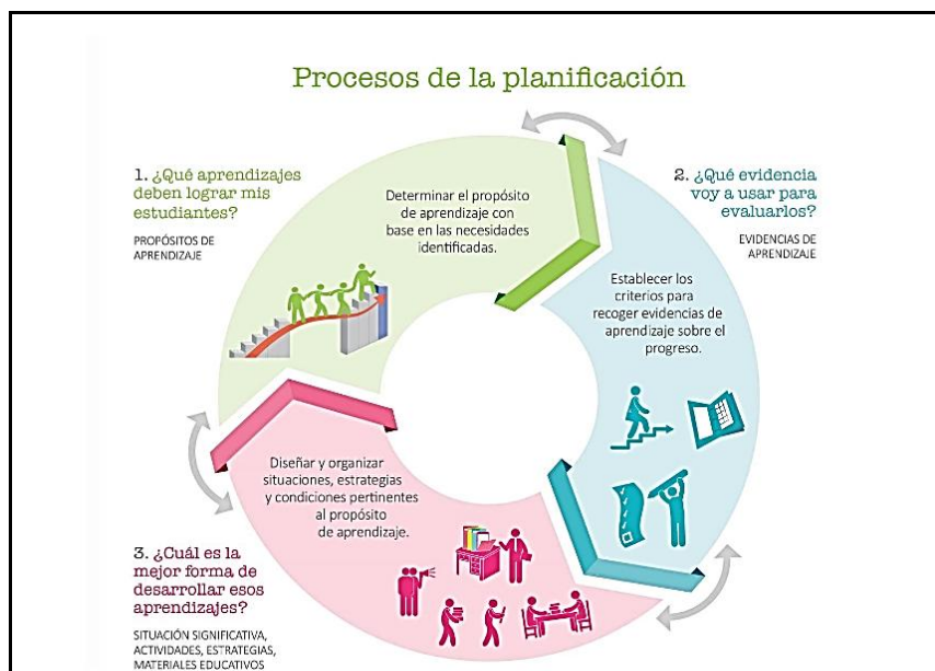
Figura 5. Procesos de la Planificación (Cartilla de planificación curricular 2017)

Los Procesos pedagógicos de una sesión de aprendizaje pueden darse en forma recurrente durante la sesión y son: problematización, propósito y organización, motivación, recojo de saberes previos, gestión de los aprendizajes, aquí discurren los procesos didácticos del área (comprensión del problema, búsqueda de estrategias, representación, formalización, reflexión y transferencia) y evaluación.