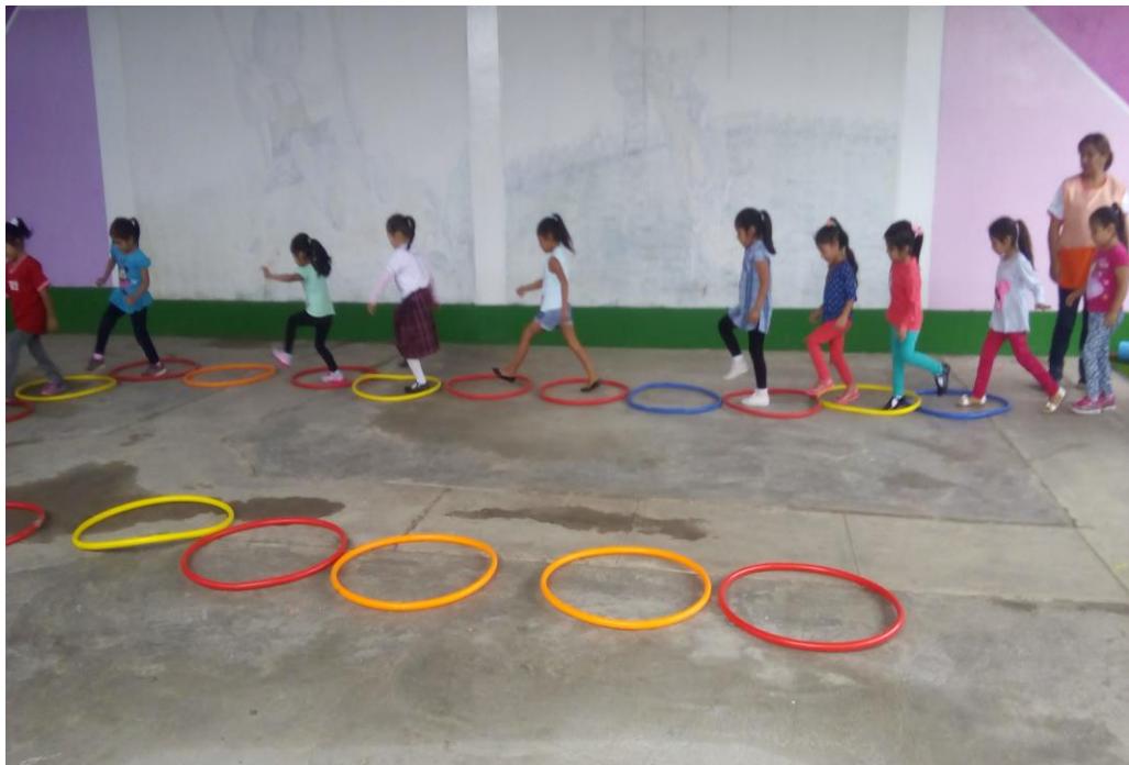
Niños y niñas desarrollando su psicomotricidad en el patio.