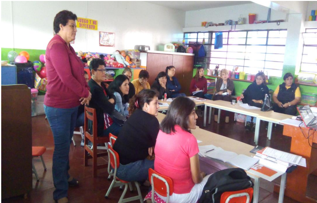
TRABAJO COLEGIADO CON LAS DOCENTES: Analizando y reajustando sesiones de aprendizaje