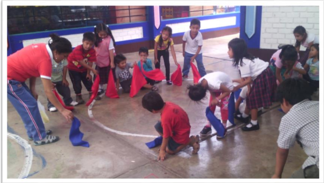
MONITOREO DE UNA SESIÓN DE APRENDIZAJE