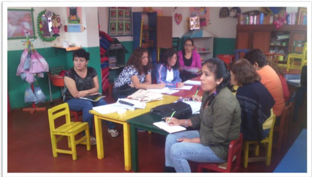
EVALUANDO ENTRE PARES LOS AVANCES DE SU PROGRAMACIÓN