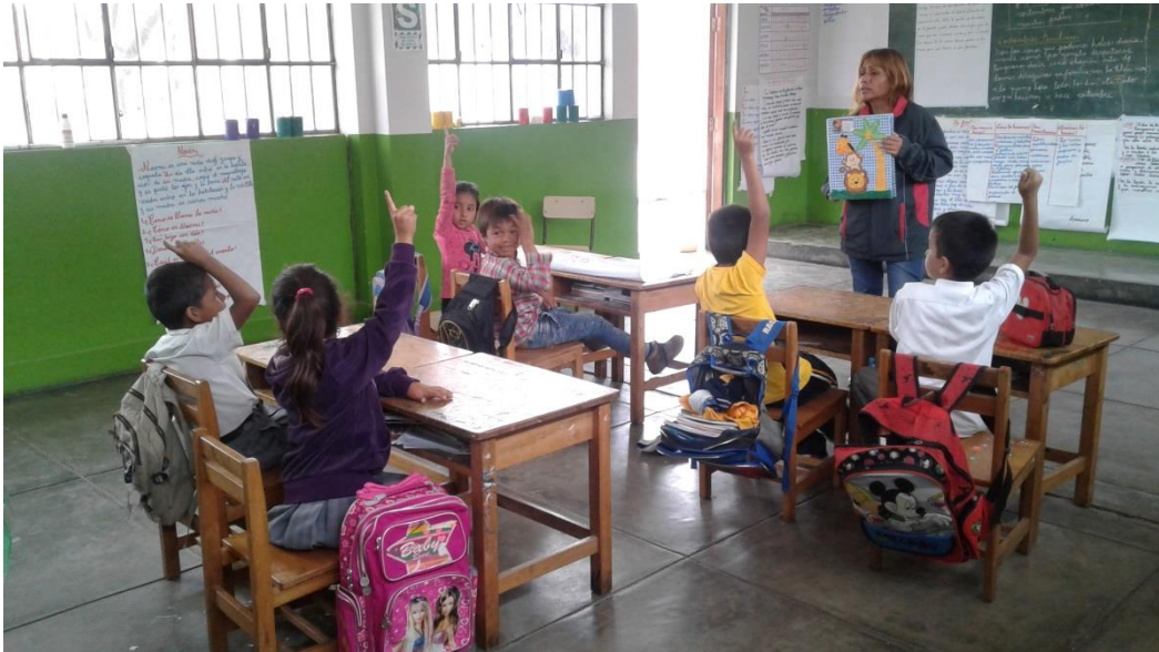
Directora de IE N° 81566 monitoreando la práctica pedagógica en el área de Comunicación.