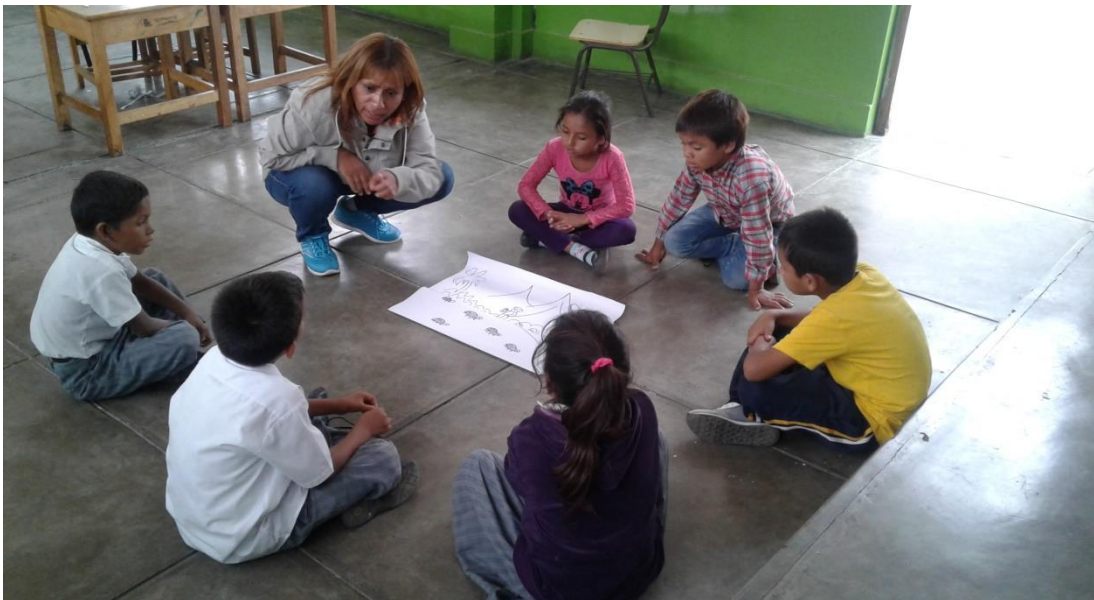
Directora de IE N° 81566 monitoreando a docente de aula