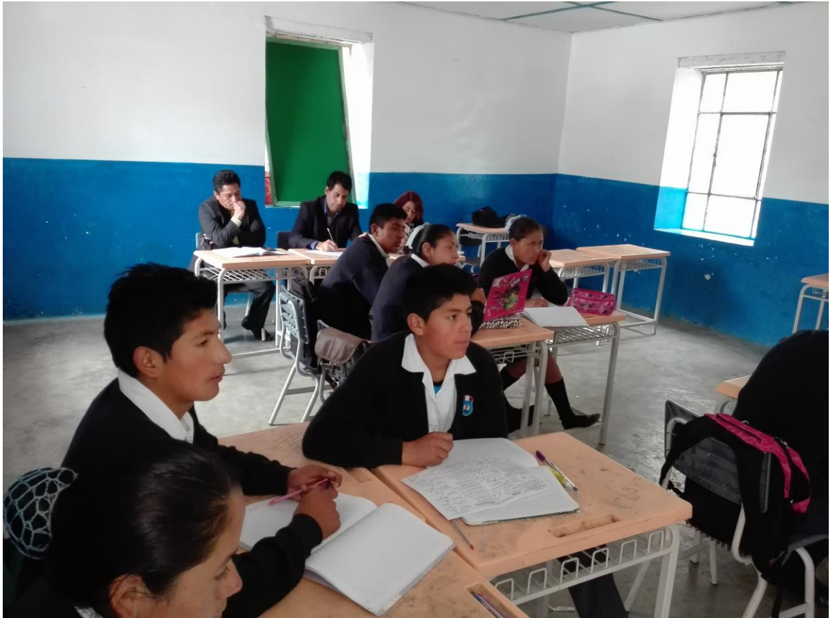
El Director y coordinadores pedagógicos de la Institución Educativa César Vallejo de Buldibuyo realizando monitoreo y acompañamiento a un docente del área de comunicación de VI Ciclo de EBR