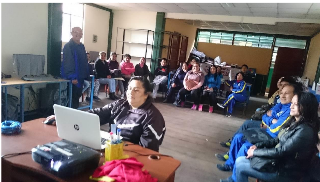
Taller de capacitación a los docentes de la Institución Educativa sobre Currículo Nacional