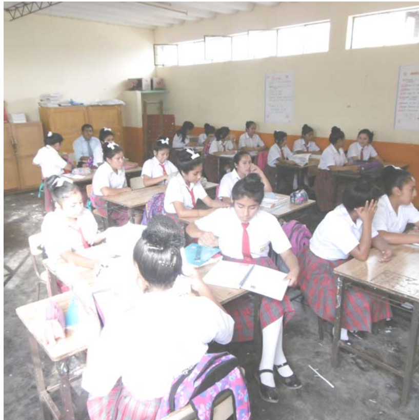
Realizando monitoreo de una sesión de aprendizaje en el Área de Comunicación