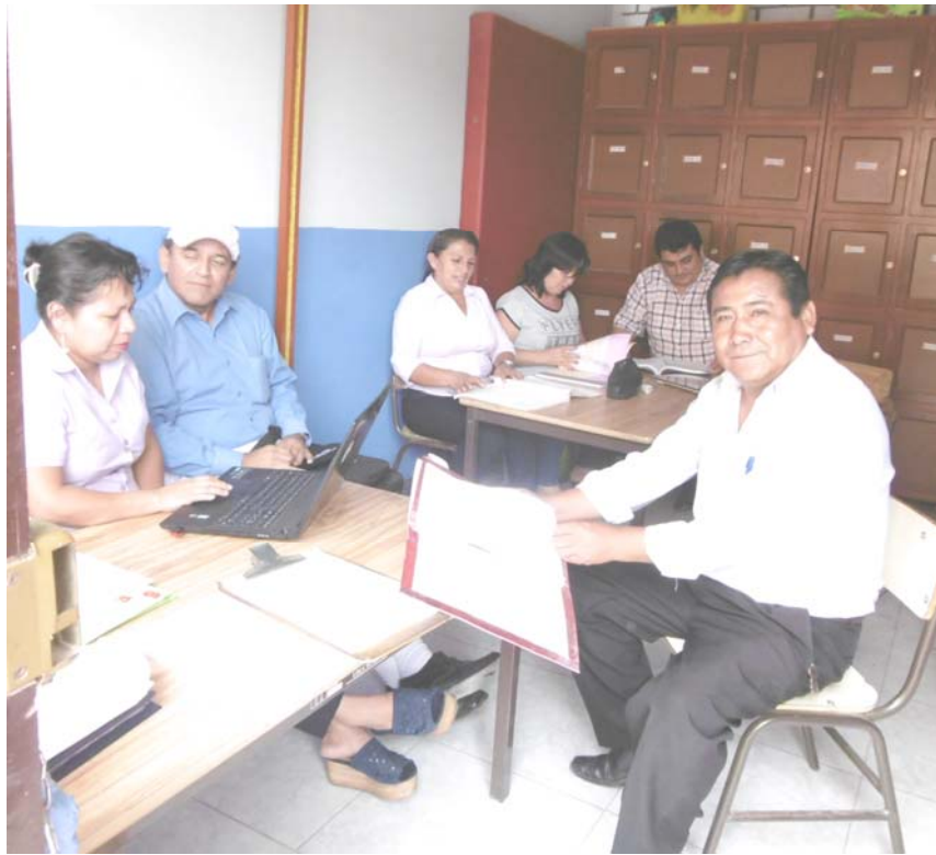
Participando del trabajo colegiado con los Docentes del Área de Comunicación