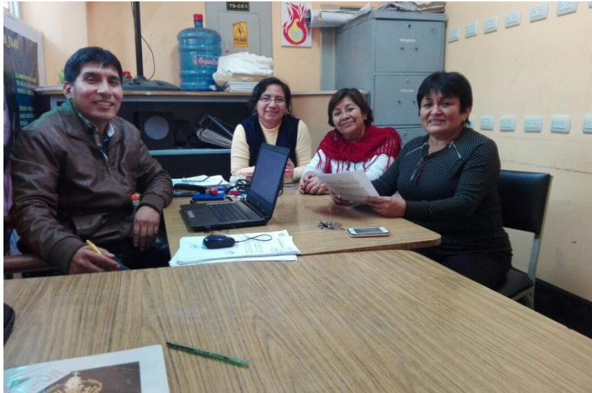
Socializando los instrumentos de recojo de información con los docentes del área de religión del turno de la tarde.