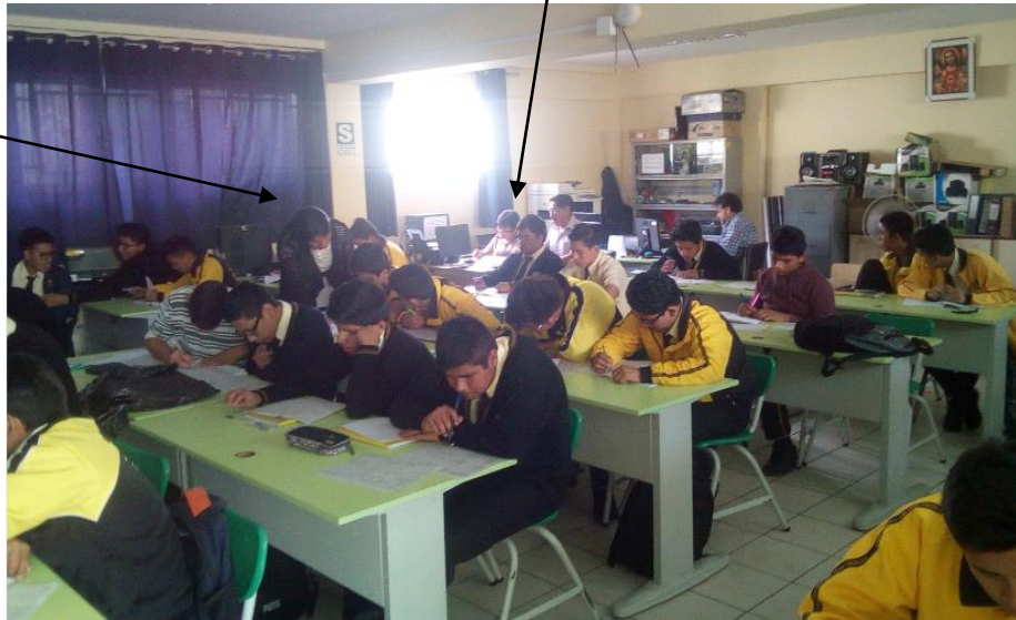
Aplicando la ficha de monitoreo de la práctica pedagógica a docente de religión.