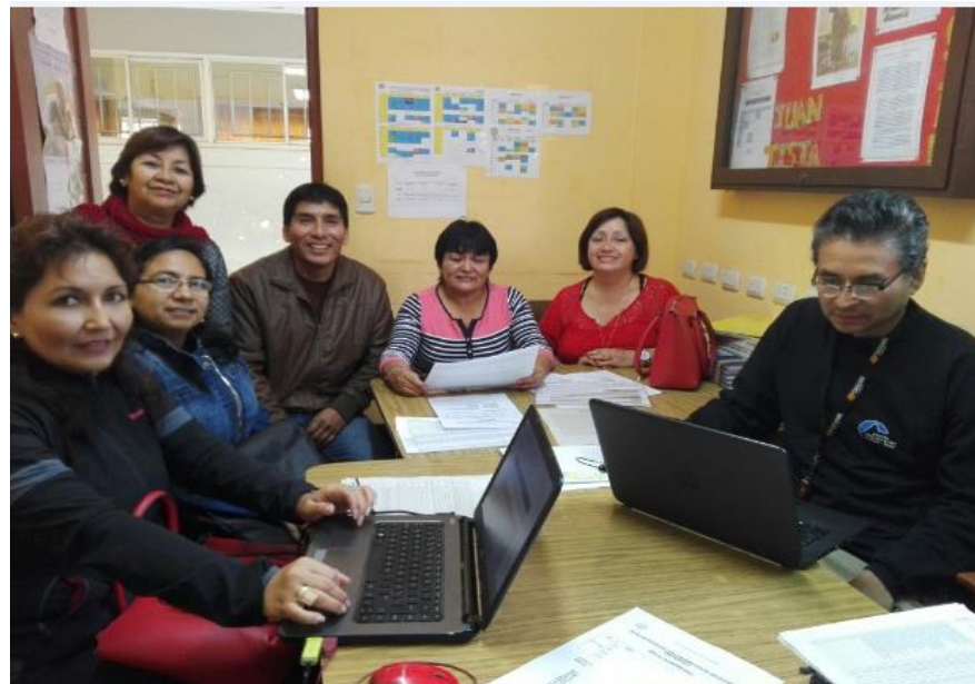
Aplicando el focus group de recojo de información a los docentes del área de religión.