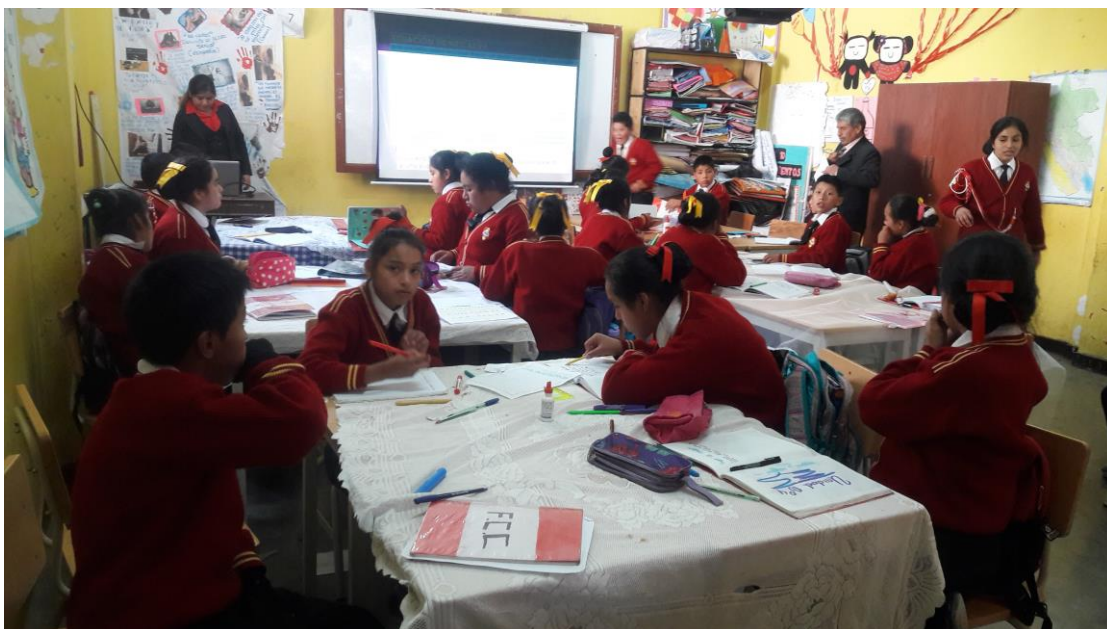
Realizando el monitoreo pedagógico