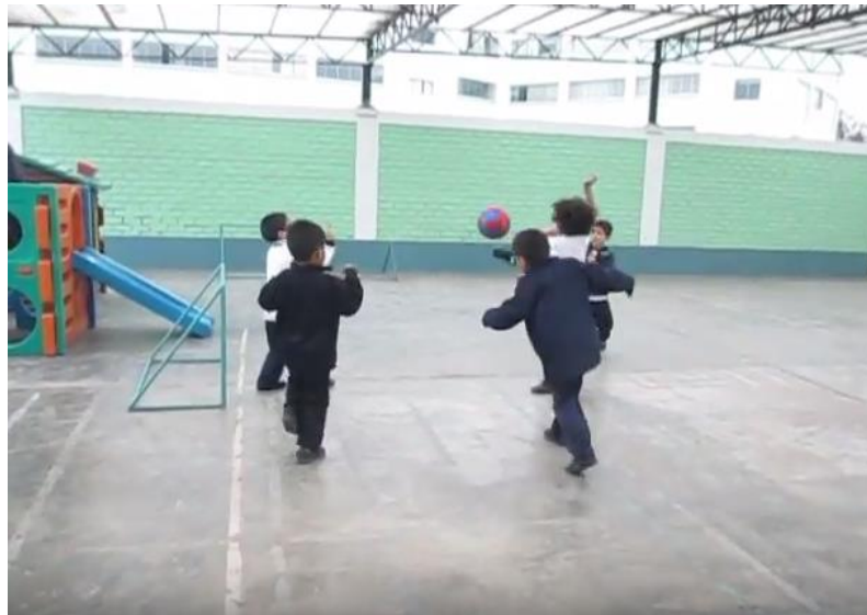
Los niños juegan al fútbol con amigos del mismo sexo