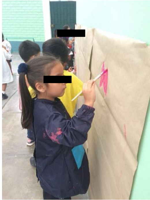
Pinta con tonalidades rosadas