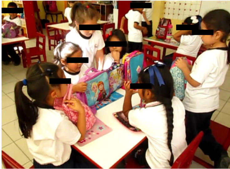
Estereotipos de personajes