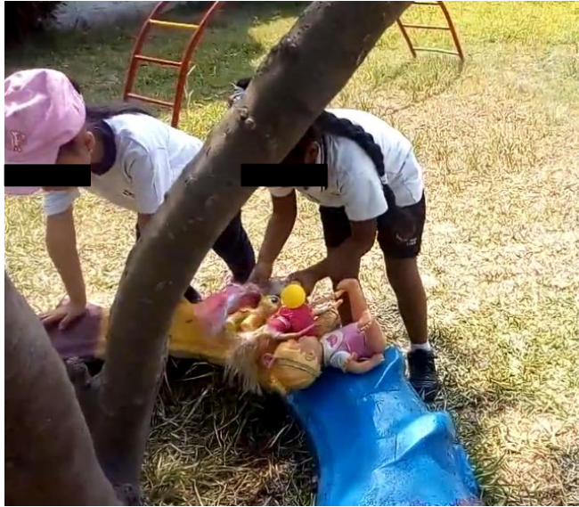
Niñas jugando con muñecas