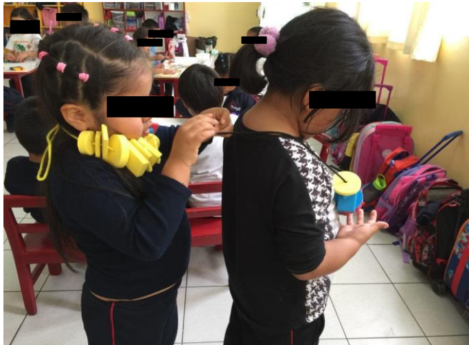
Estereotipos en prendas de vestir