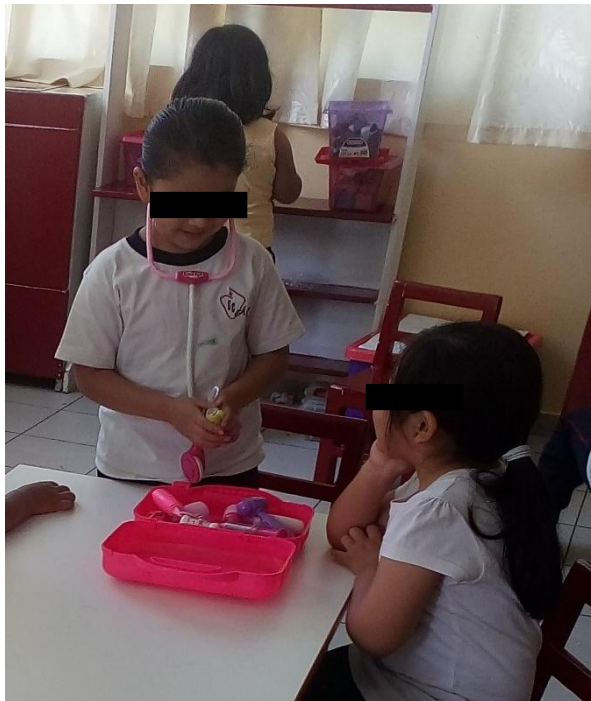
Niñas asumiendo el rol de enfermera - paciente