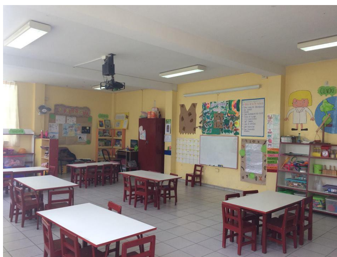
Figura 7. Aula Girasoles 5 años