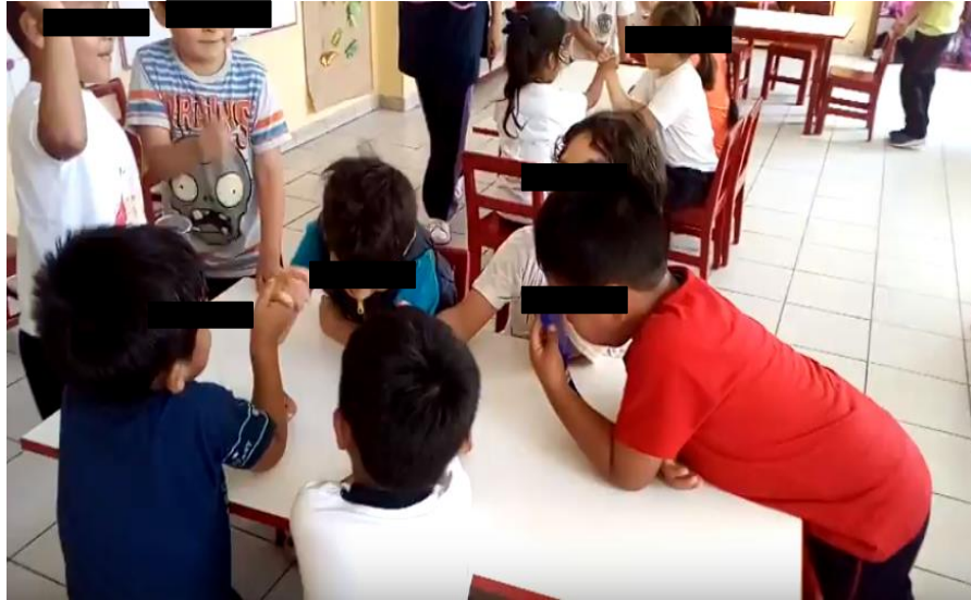
Juegan juego de “fuerza”