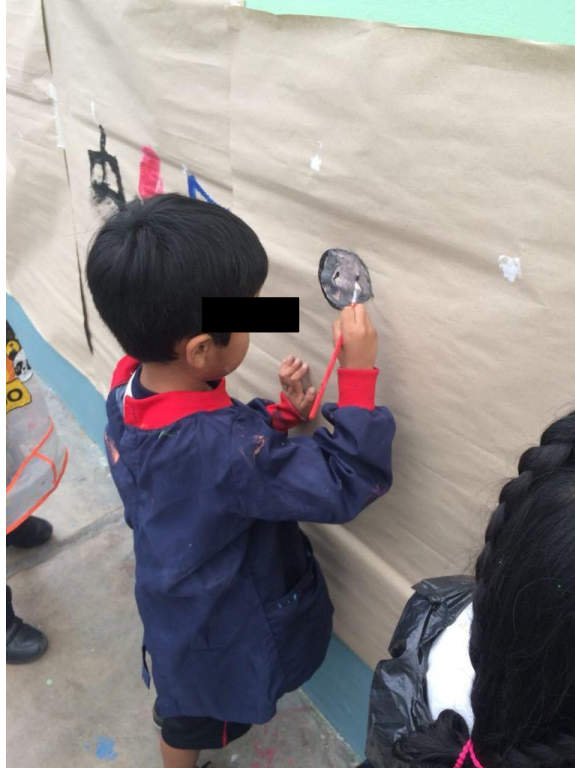
Pinta con tonalidades oscuras