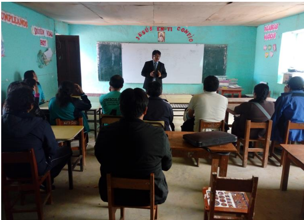
Reunión de coordinación del director con los profesores de la IE.