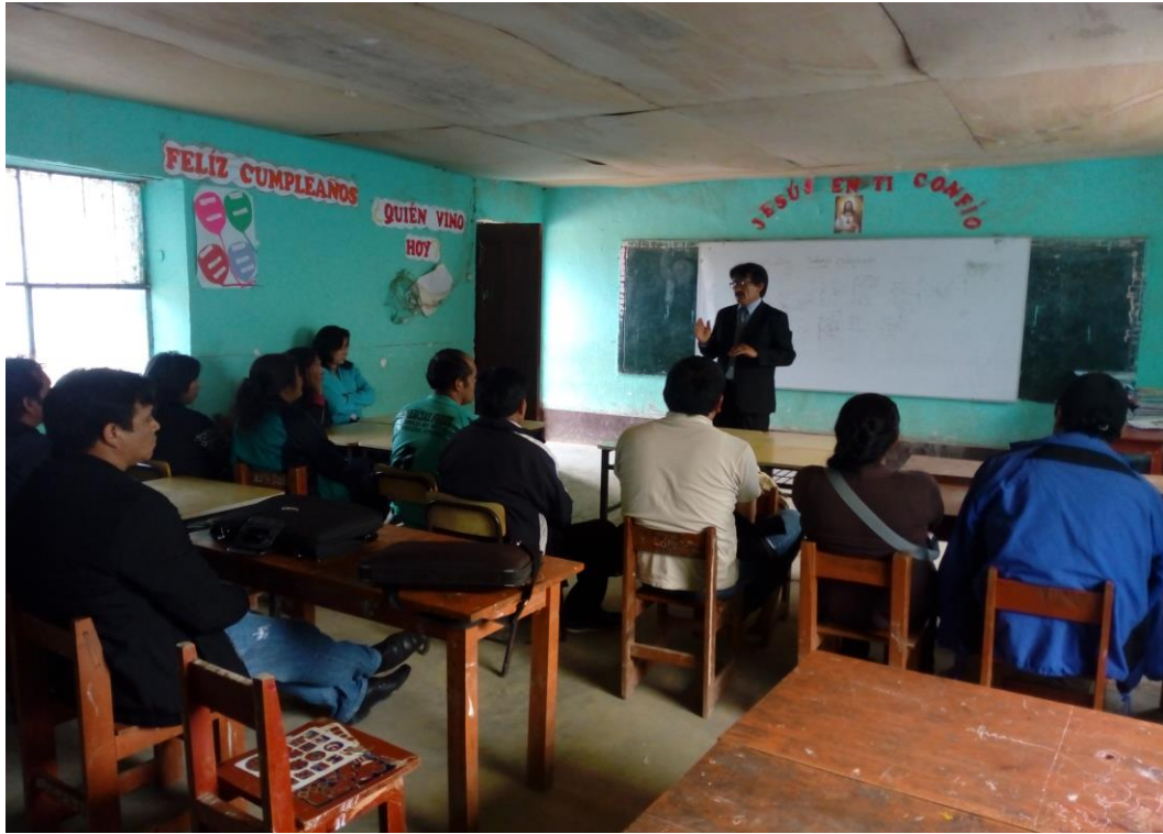
Reunión General con los Docentes – Trabajo Colegiado.