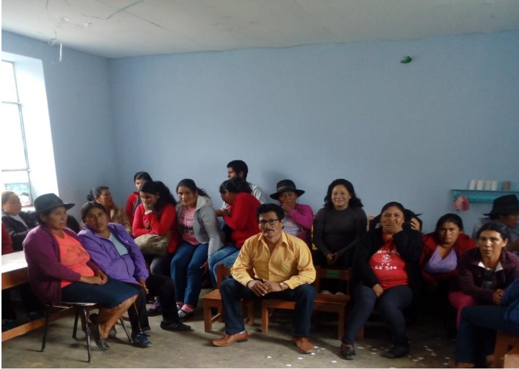
Reunión con padres de Familia del III Nivel de EBR