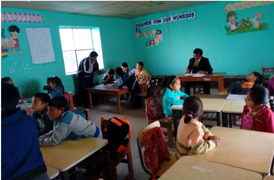
Visita del director al Aula de 2° Grado de Primaria de la IE. N° 80438/A1-P-EIPSM