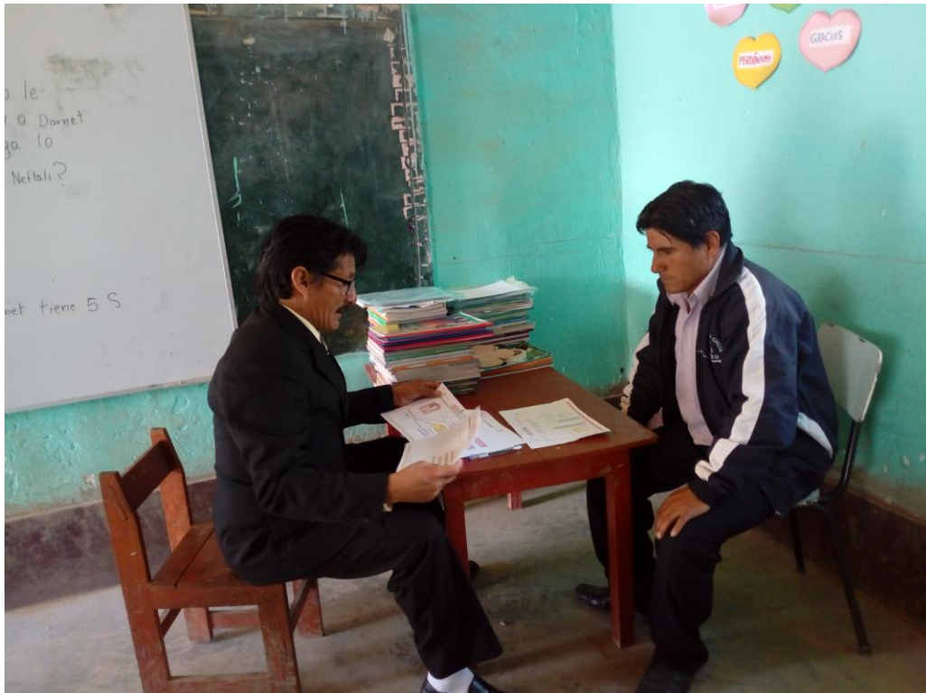
Acompañamiento Docente del III Nivel de EBR