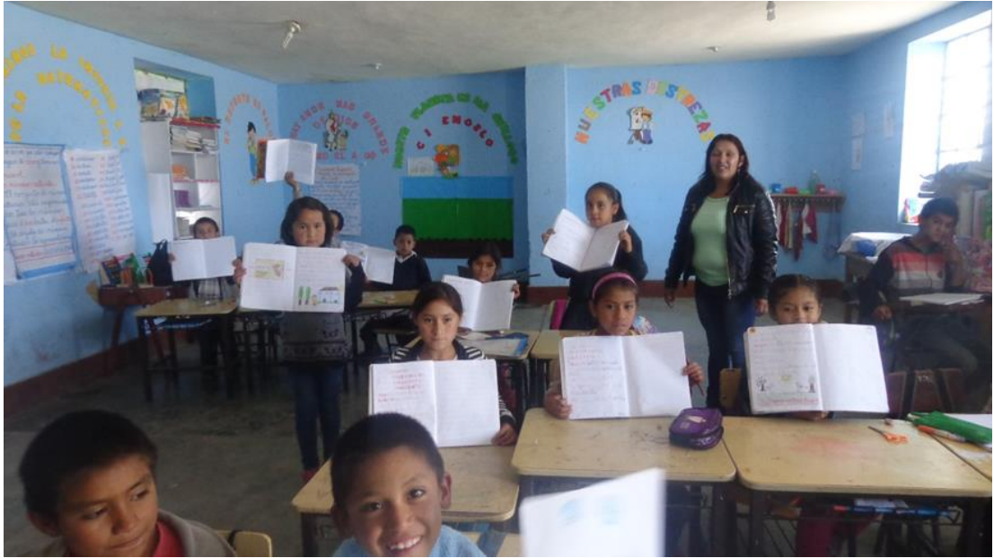
Monitoreo de una sesión de aprendizaje en el área de Comunicación en el 4º grado sección “B”