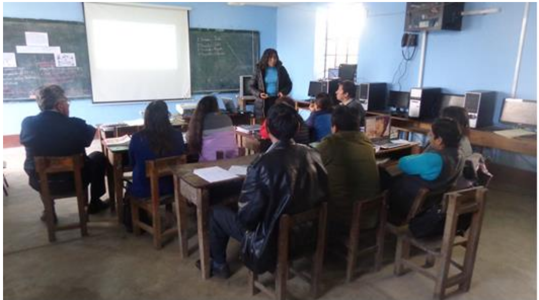
Reunión de interaprendizaje