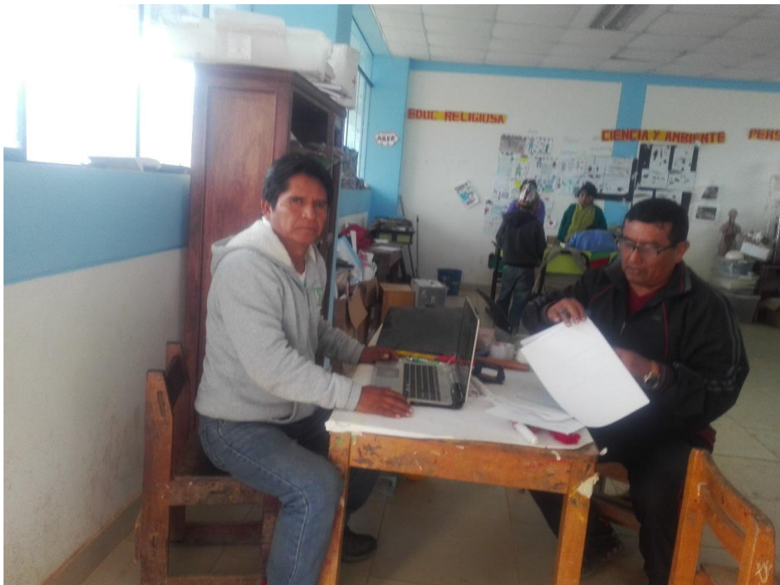
Círculo de interaprendizaje sobre estrategias para la enseñanza- aprendizaje de la comprensión lectora