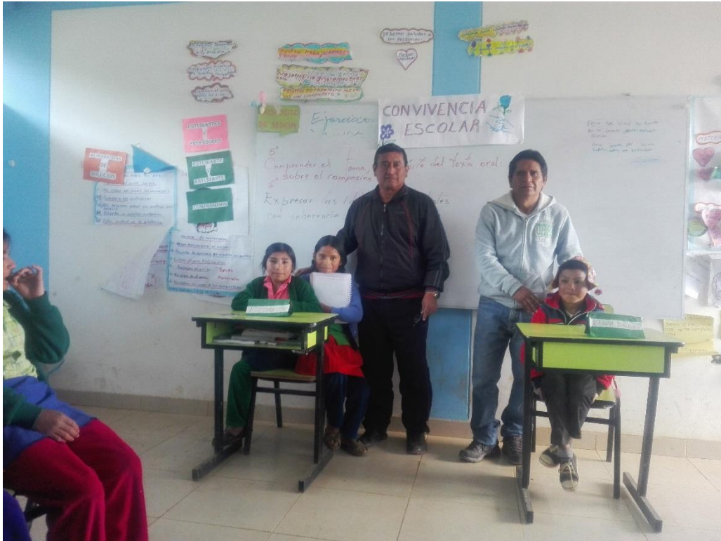
Circulo de interaprendizaje sobre convivencia escolar