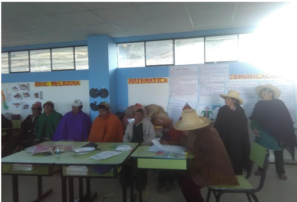
Charlas sobre convivencia escolar con los padres de familia