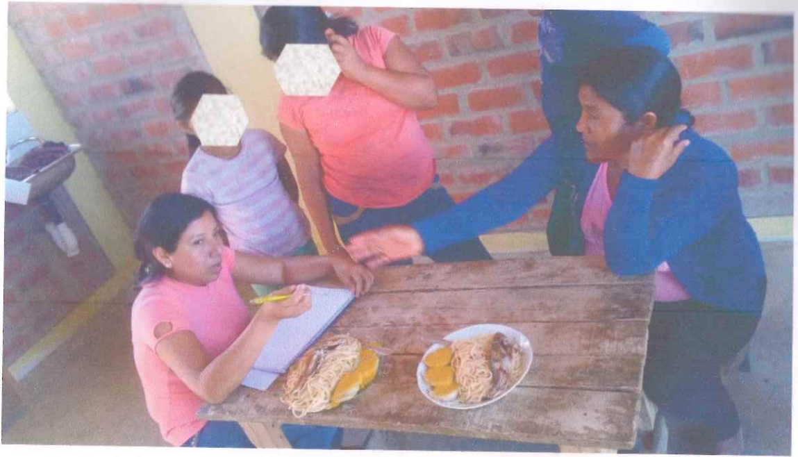
Figura F3. Aplicación del registro etnográfico