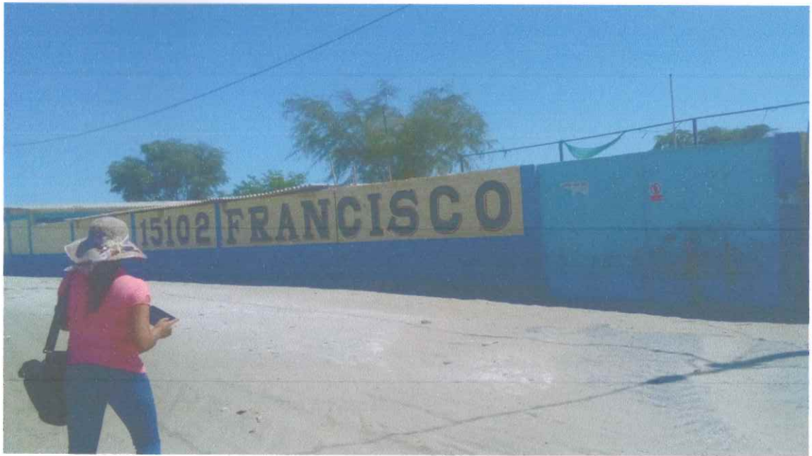
Figura F1. Frontis de la I.E. Francisco Bolognesi – El Tabanco.