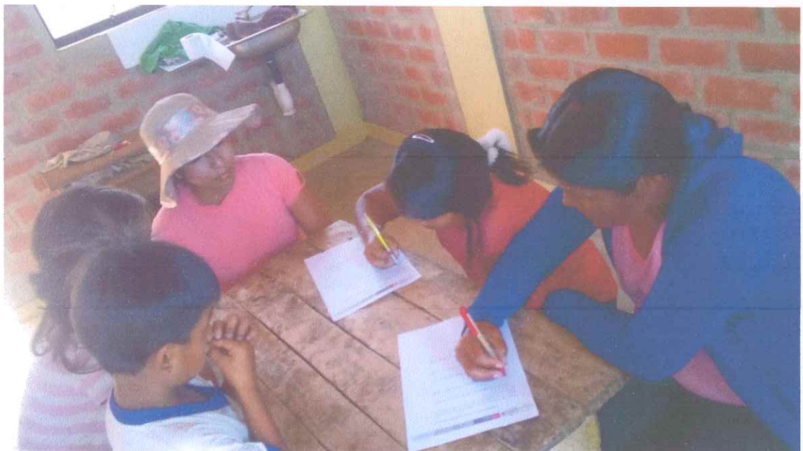
Figura F2. Aplicación de los instrumentos de evaluación (cuestionarios).