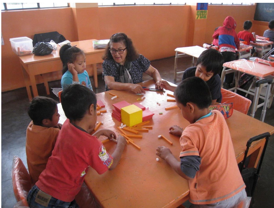
Monitoreo a la docente