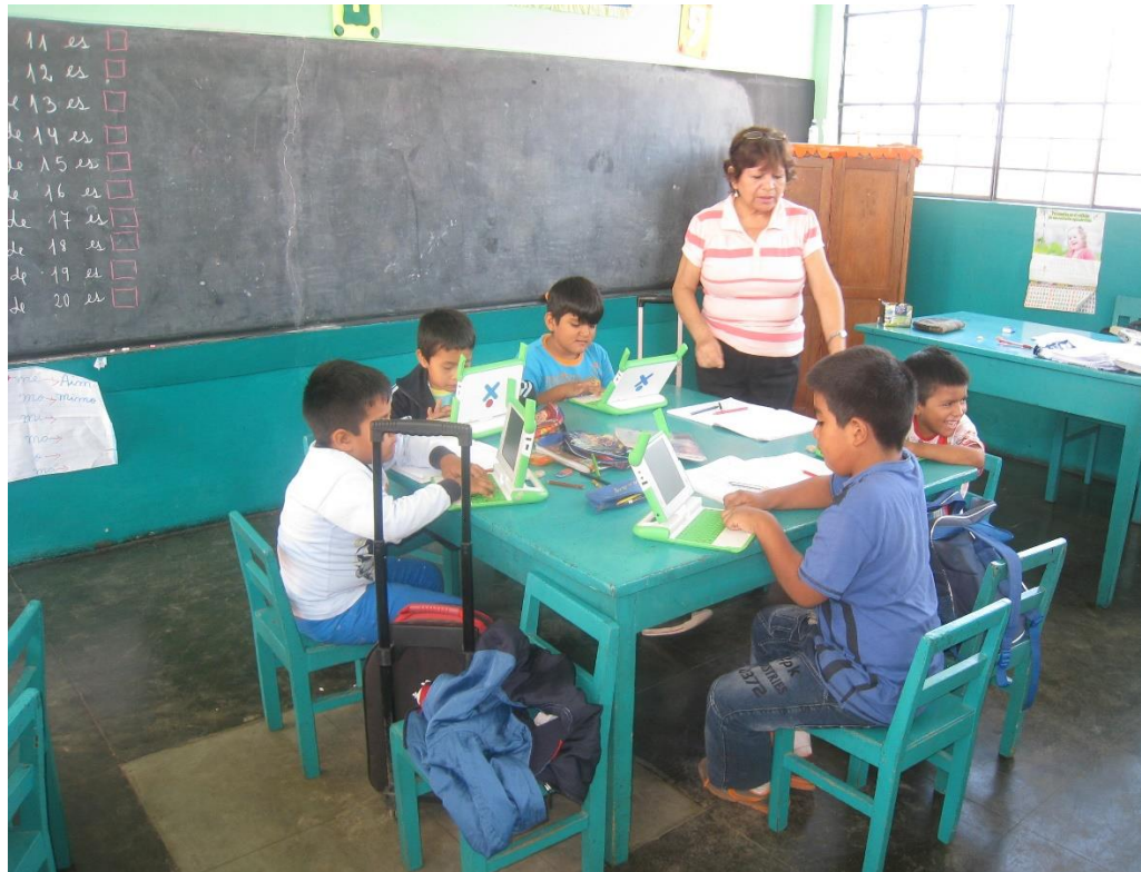
Monitoreo de la Práctica Docente