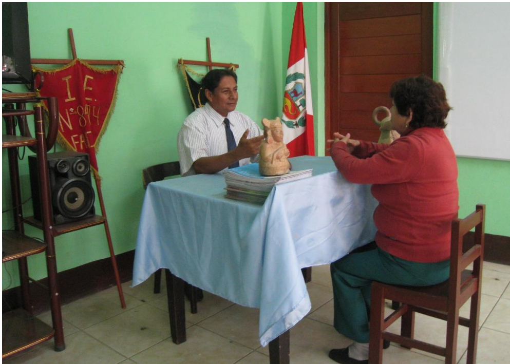
Acompañamiento pedagógico a la docente