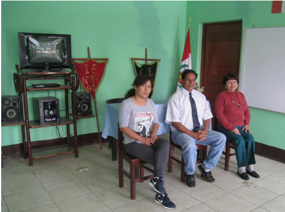
Jornada de Acompañamiento Pedagógico