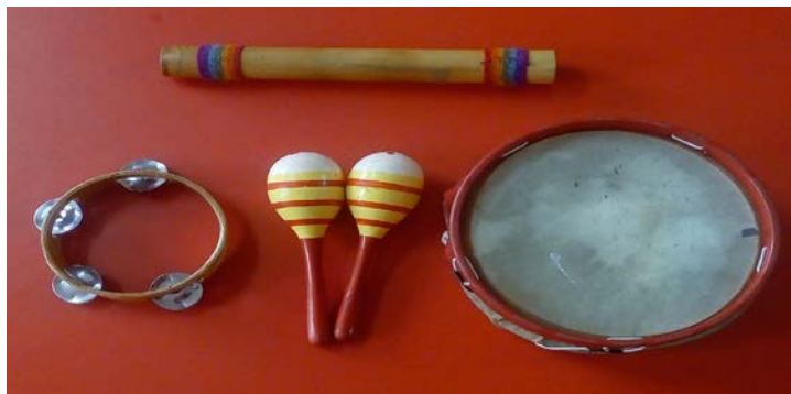
Figura 13. Instrumentos que se utilizan en aula.

Instrumentos sencillos: Según la pedagogía recomienda que no se empleen instrumentos de percusión en edades tempranas, ya que los niños de por sí son seres de movimiento y lograr un equilibrio entre el desorden y la calma puede encontrarse con instrumentos sencillos tales como la lira, un arpa o la flauta.