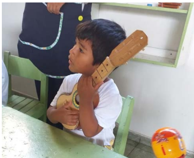
Figura 8. Los instrumentos como ayuda para generar sonidos, ritmo y transmitir emociones y sentimientos

Según Barbarroja (2007), algunos de los principios metodológicos de la Educación Musical en la etapa inicial son los siguientes: