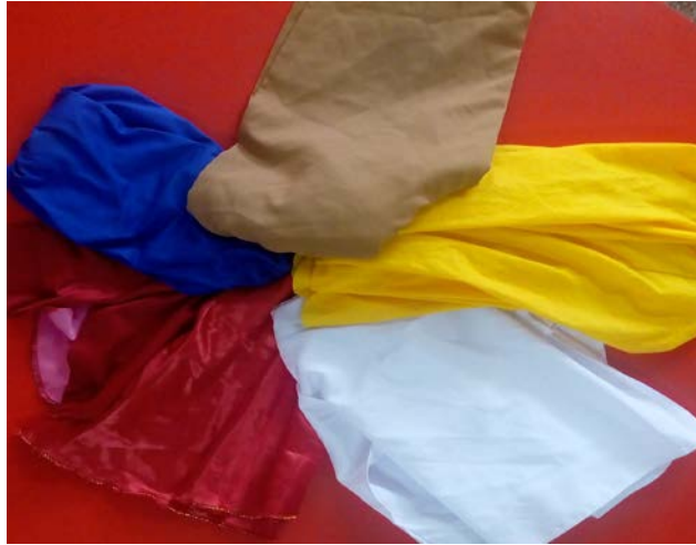
Figura 10. Las telas representan para ellos la posibilidad de interpretar los personajes.

Materiales naturales: En la actualidad, la mayoría de los materiales son elaborados a base de plástico, impidiendo que el niño logre una mayor exploración empleando sus sentidos, los cuales se encuentran muy alertas en esta época. Además, que estos limitan la imaginación o creatividad ya que normalmente vienen provistos de un uso en específico. Es así, que es importante considerar los diversos recursos que la naturaleza pueda ofrecer. El considerar a las piedras, las conchas, las hojas secas, bloques de madera, plumas, ramas, lana, algodón, y hasta el agua permitirán el disfrute de las texturas, temperaturas, aromas y formas existentes.