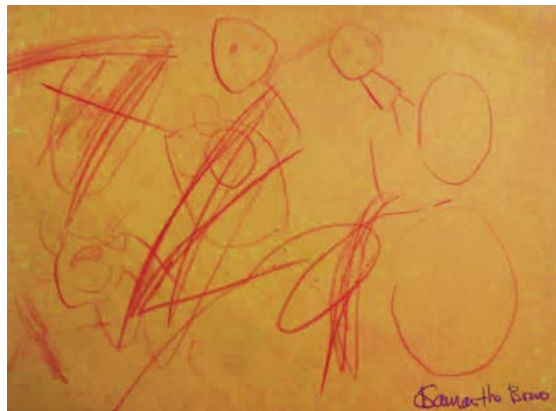
Figura 4. Garabato realizado por Samantha 3 años en un taller de Arte