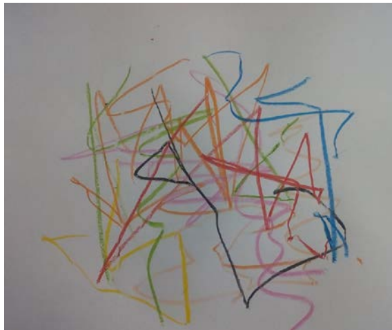
Figura 3. El niño traza las líneas moviendo todo el brazo con dirección delante y atrás sin ninguna relación con la dirección de la vista.

de los dedos y muñeca, ya que a esta edad no presentan un control muscular preciso realizando así movimientos grandes. Debemos entender que estos garabatos no deben considerarse como representaciones con significado sino como el desarrollo físico y psicológico que este va adquiriendo. Es así que el garabato es la forma en cómo los niños comienzan a dibujar.