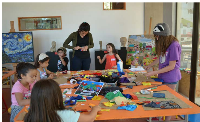
Figura 16. La tercera y última fase de la visita al museo permite la representación de los niños y niñas acerca de lo antes visto, mediante las creaciones artísticas.

Otra propuesta interesante trabajada esta vez en Brasil, en la Universidad Federal de Minas Gerais- Ayuntamiento de Belo Horizonte. Esta atiende a niños desde los 4 años hasta grupos de universitarios. Ellos realizan un recorrido por sus instalaciones las cuales se asemejan a diversos ambientes similares a las de una escuela ya sea el comedor, la biblioteca, el patio de juegos o el mismo salón de clases. Los niños y niñas que los van visitando demuestran diversas actitudes y comportamientos conforme van visitando los espacios demostrando que se acondicionan al ambiente que les parece cotidiano. Finalmente ingresan a un espacio nuevo, en el que deben quitarse los zapatos y donde encuentran diversos materiales tales como crayones, bolígrafos, hojas de colores grandes, entre otros. Este cambio representa para ellos una descontextualización inesperada a lo cotidiano que estaban experimentando. La representación de esta experiencia es la de la creación de “mapas escolares” de los sitios visitados permitiendo conocer cómo los niños ven a los espacios escolares a los cuales están habituados normalmente.