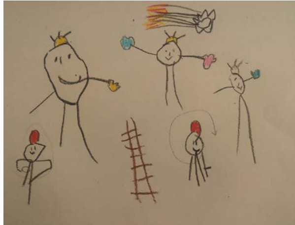
Figura 7. Los dibujos son el resultado de un desarrollo evolutivo donde un conjunto de líneas que no tienen una definición exacta comienza a hacerse más precisas y entendibles al espectador.