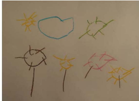
Figura 6. El niño representará mediante sus garabatos aquellos personajes cercanos a su conocimiento, pero sobre todo que les permita imaginar y crear.

plasmar lo que desean y no presionarlos a colocarles nombres que uno quisiera que tengan.