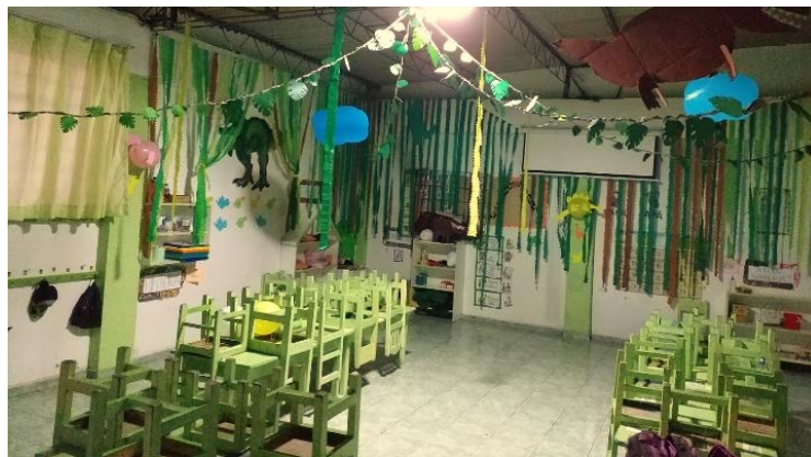
Figura 9. Las aulas de las escuelas representan los espacios formales, donde comúnmente el docente imparte las clases ya sea de arte u otras asignaturas curriculares.

Es necesario conocer sobre la existencia de dos tipos de espacios en donde se fomenta la expresión artística desde el punto de vista educativo. Por un lado, un espacio más formal y clásico donde se da la enseñanza del arte en sí mismo, es la escuela, las aulas en concreto. Sin embargo, también es importante mencionar a los espacios no tan formales como son los ambientes externos a la institución educativa tales como las bibliotecas, ludotecas, los museos, los espectáculos temáticos en centros culturales, las presentaciones teatrales o demostraciones de títeres, así como cualquier otro tipo de ambiente público, ya que estos representan otra oportunidad distinta a la que comúnmente se emplean donde el niño será capaz de vivir otro tipo de experiencia de conocimientos y sobre todo de expresión de estas mismas.