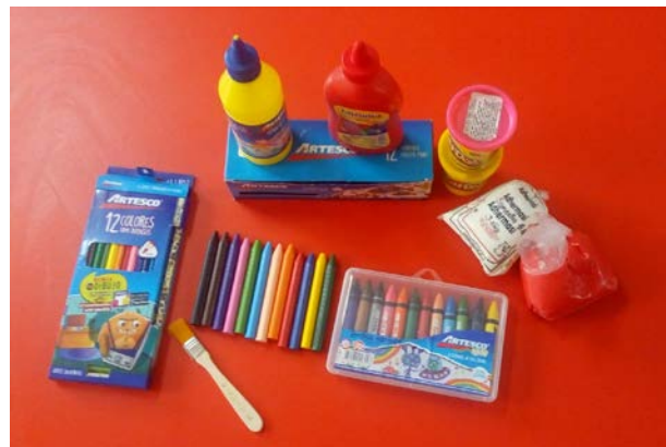
Figura 12. Materiales que podemos utilizar para una representación gráfico plástico

Bloques de cera, acuarelas y ceras para modelar: Dichos materiales facilitan la manipulación, exploración y sobre todo permiten descubrir nuevas tonalidades, las cuales a veces son complicadas de lograr con colores comunes. Además, muchos de estos despiden aromas agradables que permiten incrementar aún más el interés al momento de realizar las creaciones.