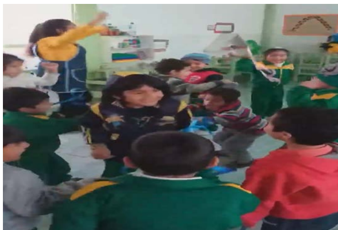
Figura 1. Representación de las emociones, sentimientos y vivencias mediante el movimiento corporal libre.

El propósito principal que pretende alcanzar la danza creativa es permitir que el niño se familiarice con el ejercicio de poder cultivar la espontaneidad y naturalidad expresada a través del movimiento, gozando de dicha experiencia mediante la flexibilidad, fluidez y expresividad.