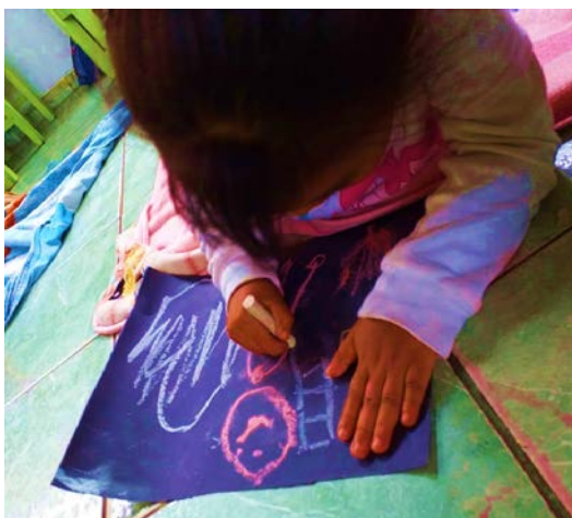
Figura 2. La expresión gráfico plástico formaliza la representación de manera simbólica y concreta exteriorizada por medio de trazos y grafismos.

Si bien el arte comprende la expresión libre del cuerpo y la creatividad mediante la representación o dramatización de sus vivencias, el niño también será capaz de crear mediante la habilidad de la escritura, con mayor precisión por medio de la expresión gráfico plástico. El niño mediante un dibujo será capaz de plasmar su forma de ser, sus emociones y sentimientos, su imaginación, creatividad, la realidad en la que se desenvuelve; poniendo en juego todas sus capacidades. Por ello, para Pérez (2013) “la expresión plástica tiene una función de expansión de emociones, creatividad, juego. Es una manera de expresar sentimientos, miedos, ideas y lo harán sin límites siempre y cuando el adulto no se los imponga.”