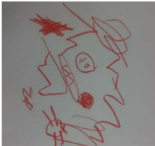
Figura 5. El niño se da cuenta de la posibilidad que tiene de poder controlar sus movimientos (control motor), relacionando sus movimientos con los trazos realizados.

Las líneas generadas a través del trazo en su mayoría son horizontales, verticales y circulares. Generalmente se acercarán demasiado a la hoja de papel mientras dibujan. Y en ocasiones se encontrará cierta relación entre sus dibujos y algo que ocurra en la realidad.