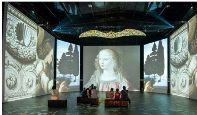
Figura 14. La primera etapa de visita en el Museo Artequin, permite al niño un mejor entendimiento de sus significado e historia.

el Museo pretende producir experiencias impactantes y cercanas al niño. La visita cuenta con tres etapas: la primera consta de una proyección relacionada al tema la cual permita entender conceptos más precisos; la segunda consiste en el acercamiento a las obras en concreto donde los niños conocerán la representación del artista y cómo ésta la plasma y por último la visita tiene como finalidad poner en práctica todo lo aprendido donde ellos y ellas tendrán la oportunidad de representar lo vivido y con materiales relacionados al tema. Todo ello ayudando a reforzar las dos etapas anteriormente trabajadas.