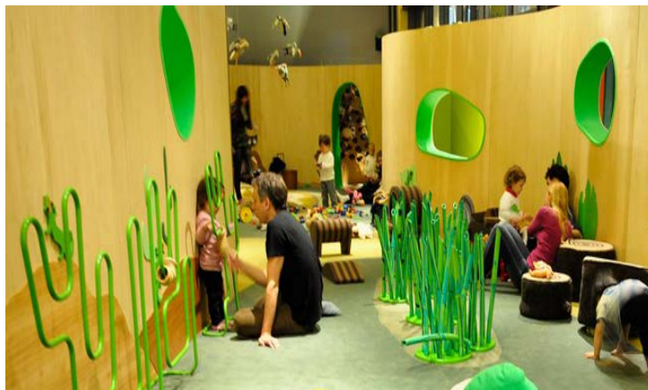
Figura 10. Los museos temáticos, los teatros infantiles, los centros culturales.

Lo valioso de reconocer ambos espacios es la intención de organizar y conectar estos, promoviendo el intercambio de experiencias entre los adultos (docentes y artistas) quienes son guías para los más pequeños. Ya que esto a su vez representará una nueva oportunidad de trabajo articulado entre escuela y comunidad, ya que los niños saldrán de las rutinarias aulas para conectarse directamente con el patrimonio cultural al que pertenecen. Y de dicha conexión se comience a establecer un ser humano más sensible e interesado en difundir mediante el arte lo que está viviendo y conociendo.