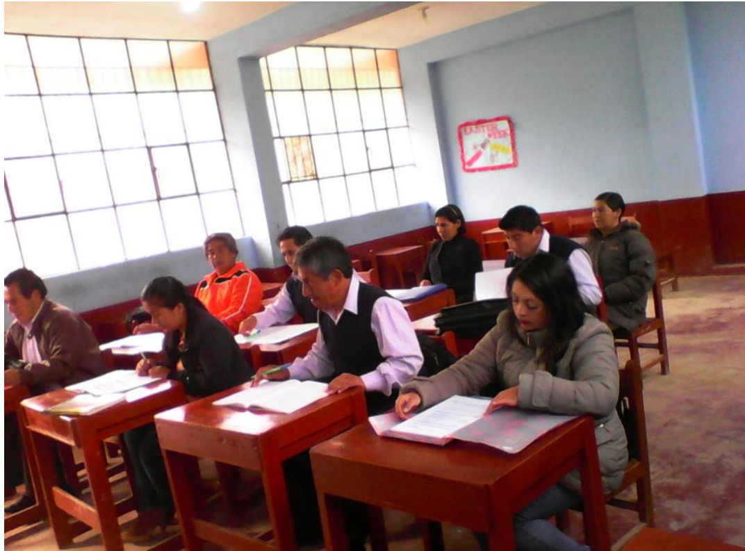
Docentes de la IE. Túpac Amaru, desarrollando el cuestionario sobre estrategias pedagógicas, monitoreo y acompañamiento y acuerdos de convivencia. 27-06-2017