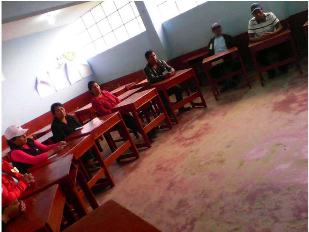
Padres de familia de la IE. Túpac Amaru participando del grupo focal. 29-06-2017