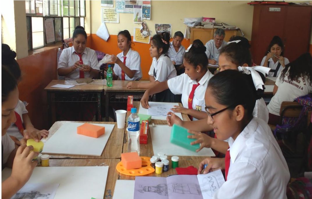
El equipo directivo realiza el monitoreo a la práctica pedagógica de la docente del Área de Arte.