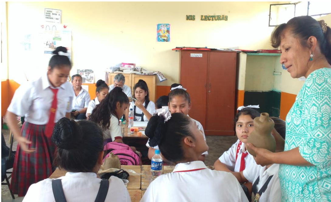
El equipo directivo visita al aula para observar la ejecución de estrategias metodológicas en el desarrollo de la sesión de aprendizaje.