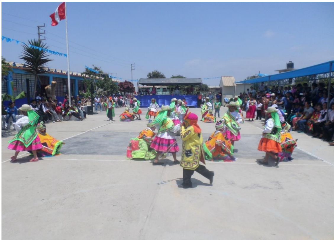
Estudiantes, docentes, directivos y padres de familia en un festival de danzas donde demuestran una convivencia democrática.