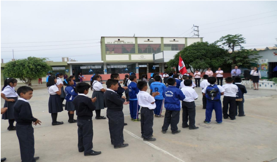
Patio de Formación de la Institución Educativa, Estudiantes y Docentes demuestran formación de ciudadanía, identidad nacional y disciplina.