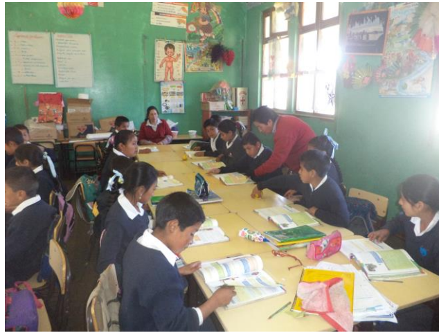
Monitoreo de una sesión de aprendizaje en el área de comunicación en el 5° grado sección "B"