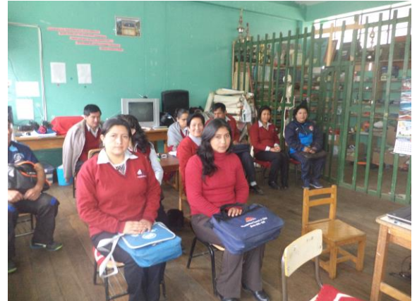
Capacitación sobre Currículum Nacional de la Educación Básica