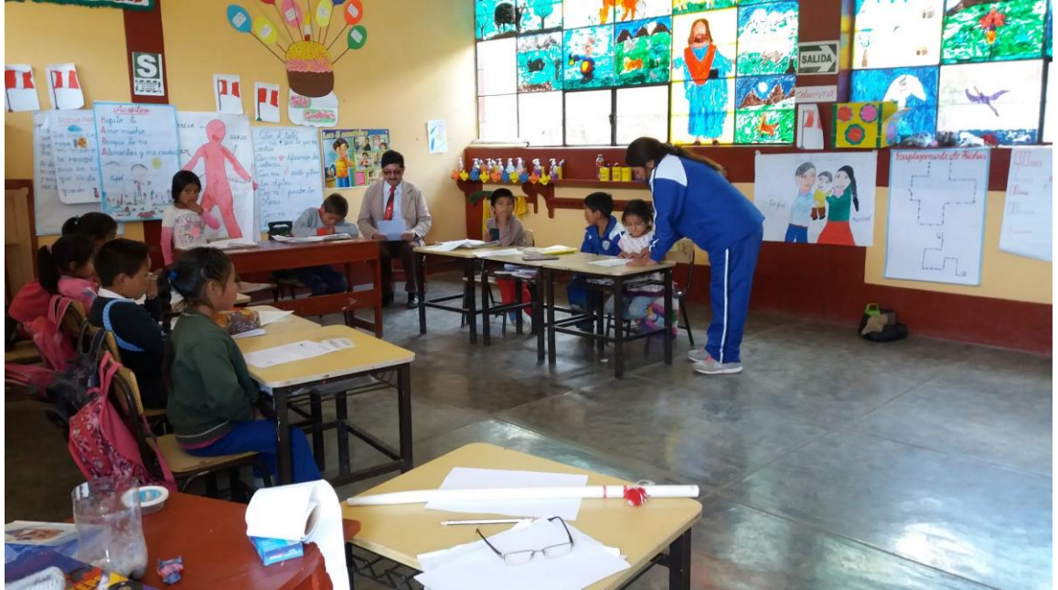
DIRECTIVO REALIZANDO EL MONITOREO AL DOCENTE EN LA PRACTICA PEDAGOGICA EN AULA