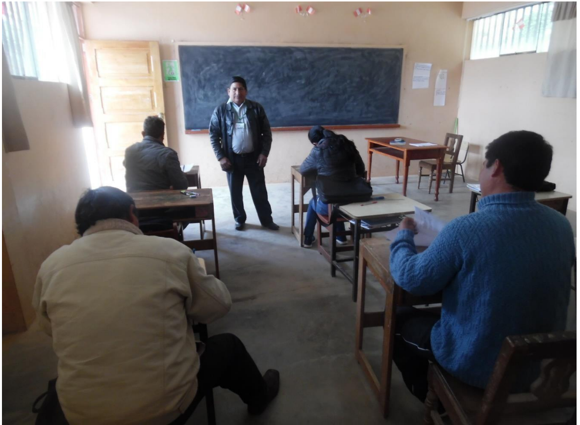
Director aplicando cuestionario sobre currículo nacional a docentes de la Institución Educativa “Ricardo Palma”, distrito de Bolívar, año 2017.