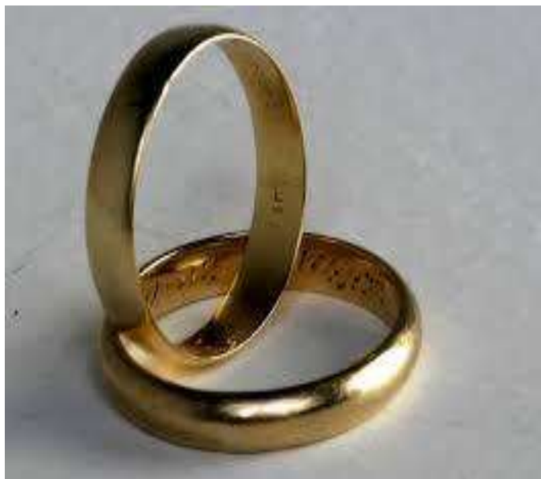
Figura 1: Sello del Modelo Conyugal en Matrimonio. Adaptado por elaboración propia

En conclusión, el modelo conyugal se convierte en una suma de activos fijos e intangibles de las partes que se juntan para compartir y desde el cuerpo físico en que se convierte para ambos “de pertenencia” y queda excluida la “infidelidad” como eje no negociable por las partes. Finalmente, el sello símbolo del modelo conyugal son los aros matrimoniales como señal. (Figura 1) y que para llegar a esta entrega recíproca deben de pasar un flujo de proceso tal como se describe en la figura 2, siendo el aro el principal articulador y cuyo sello es en el matrimonio civil.