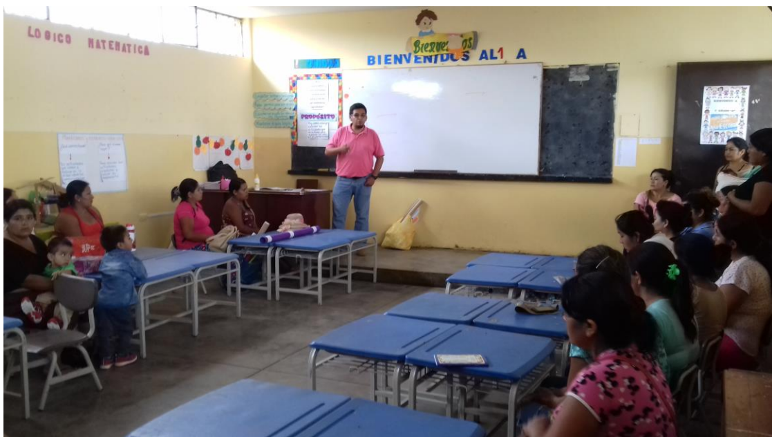
El Director de la I.E. N° 81791 “Nuestra Señora del Carmen” escuchando las necesidades de aprendizaje de los padres de familia en el área de Comunicación.