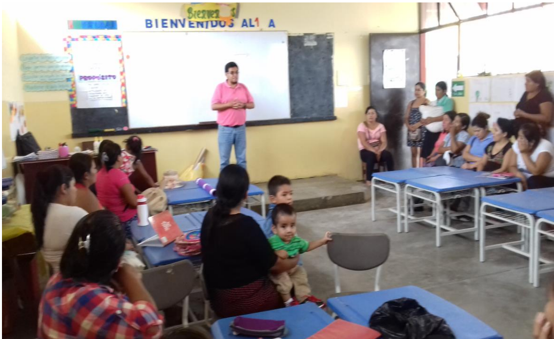
El Director de la I.E. N° 81791 “Nuestra Señora del Carmen” en reunión de coordinación con los maestros y padres de familia para la identificación del problema.