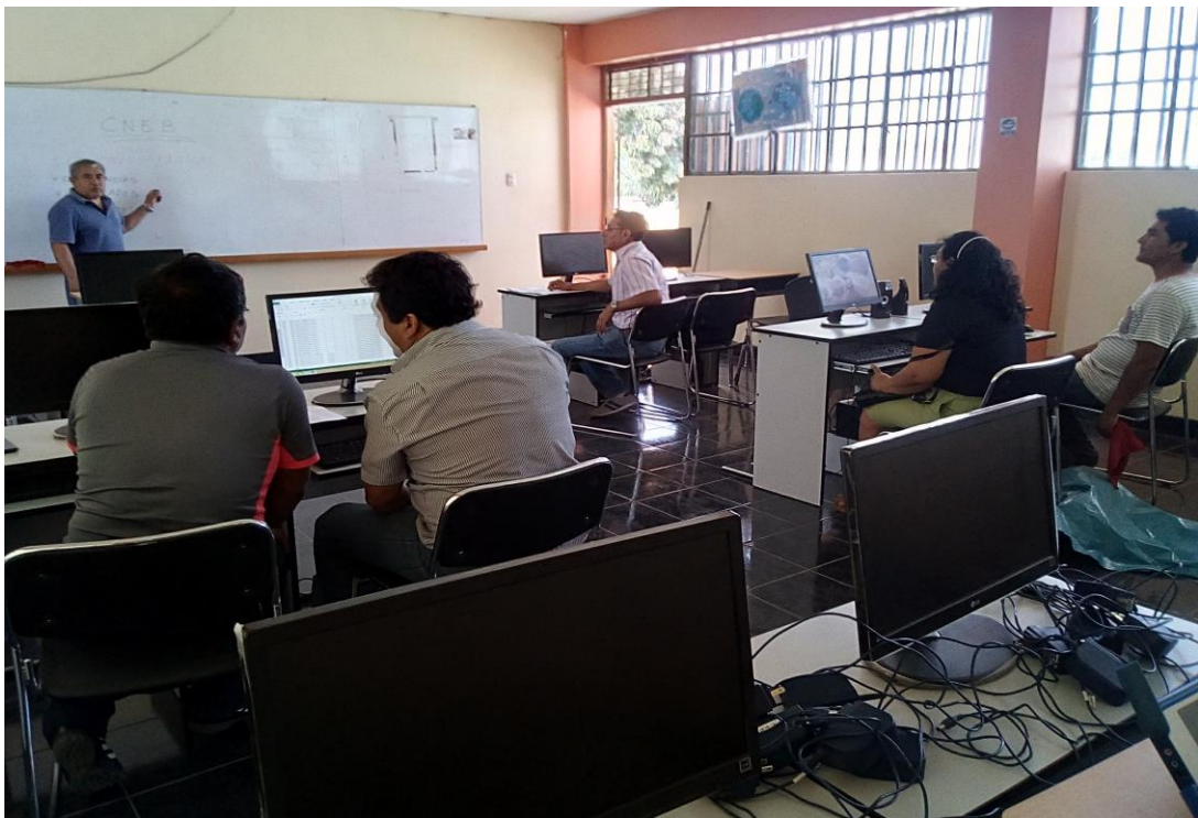
Director de la I.E “Edgardo Miguel Alarcón Vera”, desarrollando trabajo colegiado con los docentes, sobre CNEB