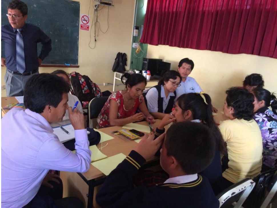
Participación de alumnos, padres de familia, y docentes en el taller.