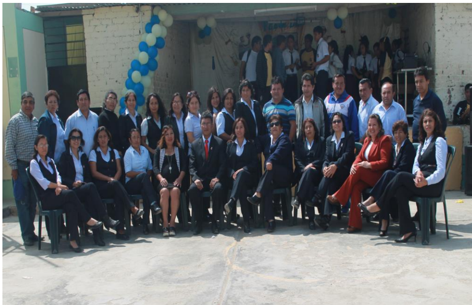
Plana docente de la Institución Educativa N° 81758 "TELMO HOYLE DE LOS RIOS"