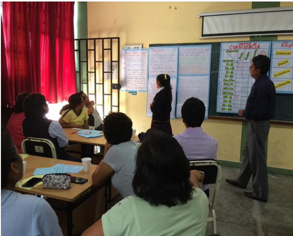
Desarrollo del taller con los estudiantes, padres de familia, y docentes.