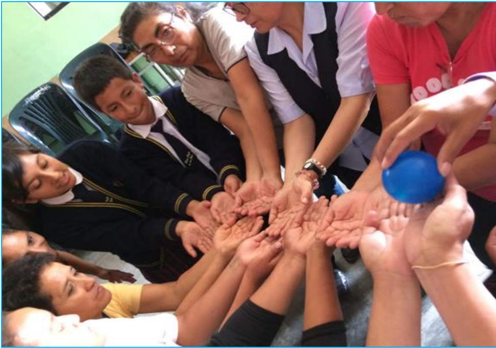
Participación de estudiantes, padres de familia, y docentes en la dinámica