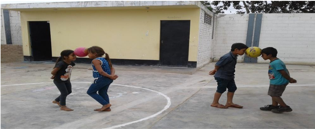
Estudiantes participando en el juego: “lleva la pelota en pareja”, dirigidos por el docente, para crear espacios de buena convivencia escolar, en la I.E N° 81567 – Guadalupe.