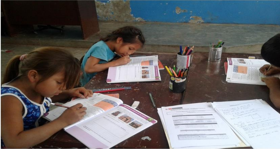
Estudiantes realizando la transferencia de sus aprendizajes, resuelven nuevos problemas matemáticos, en sus cuadernos de trabajo del MINEDU, en la I.E N°81567 – Guadalupe.