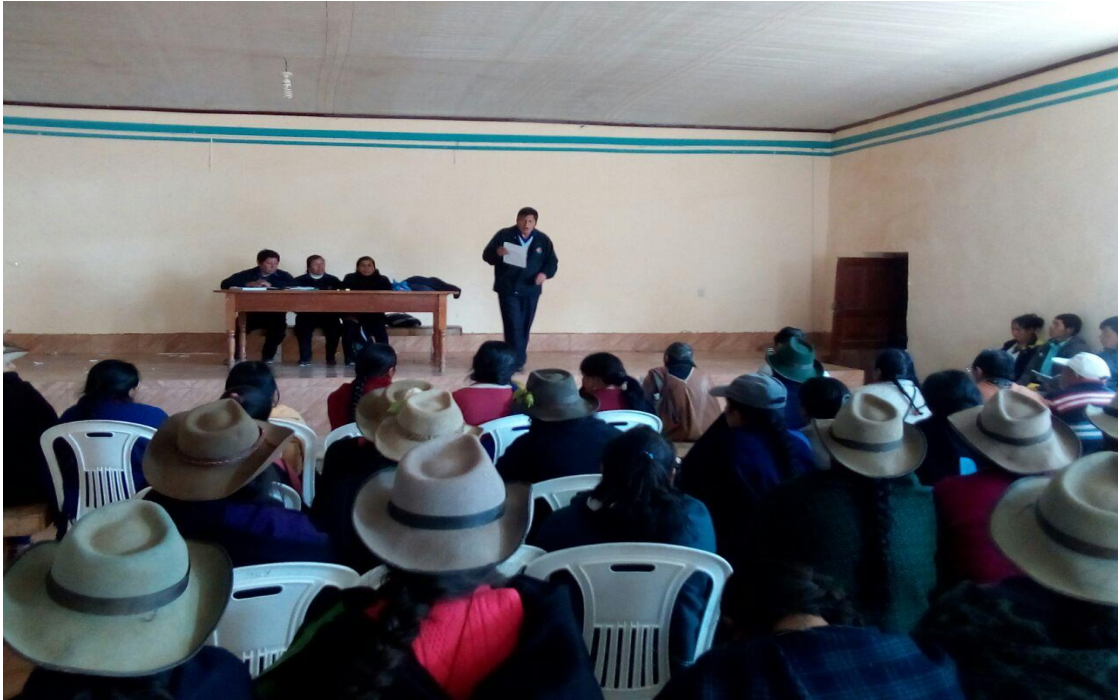
Director en reunión con la comunidad educativa para diagnosticar la problemática.