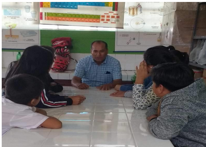
En la presente foto se observa al investigador (directivo) aplicando el guía de preguntas al grupo focal de estudiantes del VI ciclo de la I.E Imelda Cava Vargas