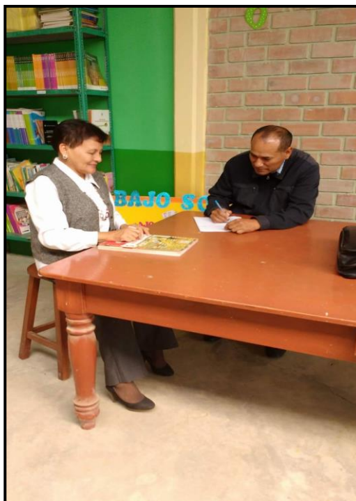
En la presente foto se observa al investigador (directivo) aplicando el guía de preguntas a la docente de comunicación del VI ciclo de la I.E Imelda Cava Vargas