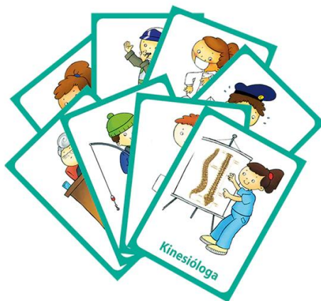
Figura 4. Imágenes para la estrategia Buffet de ideas.

Fuente: Tiendita de Aula Editores (s.f.) Caja 25 tarjetas de los oficios . Recuperado de shorturl.at/wzBL3