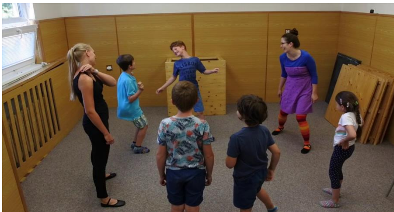
Figura 8. Evidencias de la estrategia zip, zap boing.