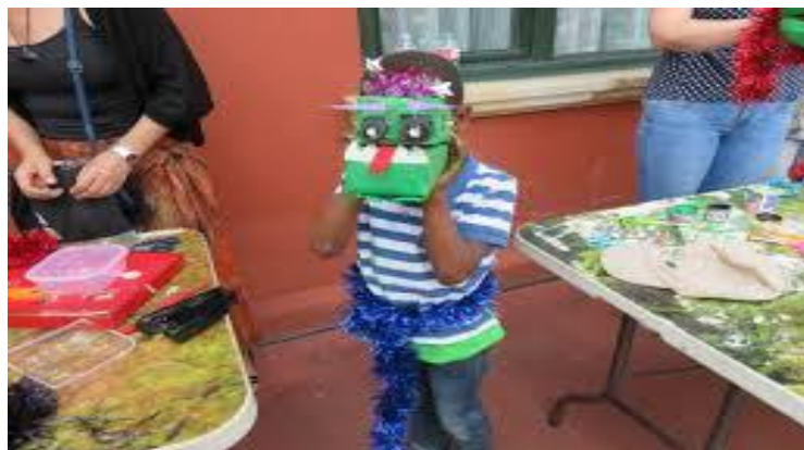
Figura 10. Material reciclado para la elaboración de vestuarios.