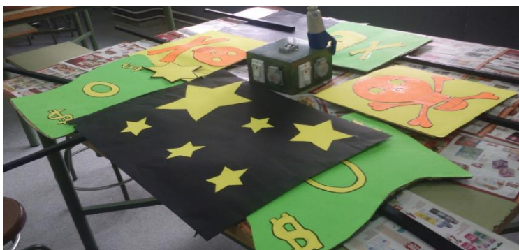
Figura 9. Cartulinas empleadas para realizar un material didáctico.