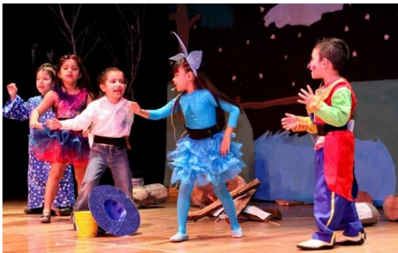
Figura 5. Evidencias de la estrategia mi nuevo amigo