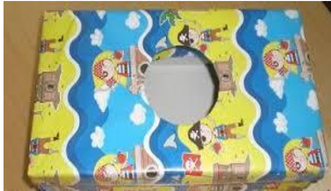
Figura 11. Caja de cartón empleada para una estrategia didáctica.