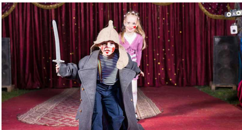
Figura 6. Evidencias de la estrategia vuelo en diferentes espacios de la imaginación.