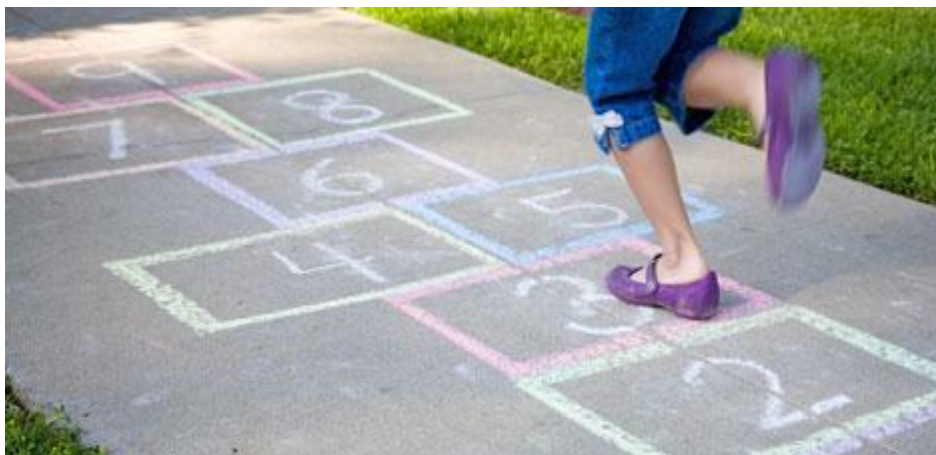
Figura 7. Evidencia de la estrategia mundo de la imaginación.