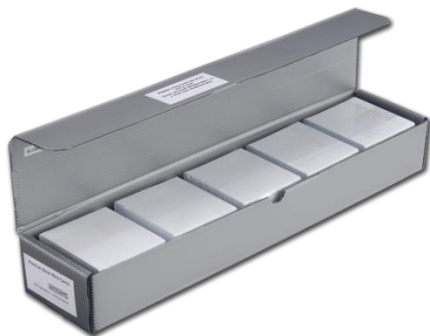
Figura 3. Evidencias de la estrategia Buffet de ideas.