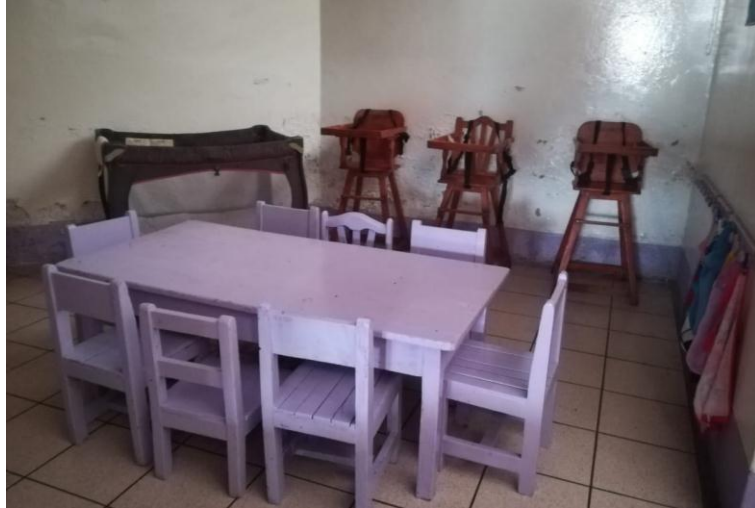
Figura N°8. Área de alimentación.

El área de alimentación cuenta con 3 sillas de comer y una mesa baja con sillas para los niños y niñas. Al lado de esta área se encuentra el área de sueño, en la que hay 1 corral y 2 cunas de madera.