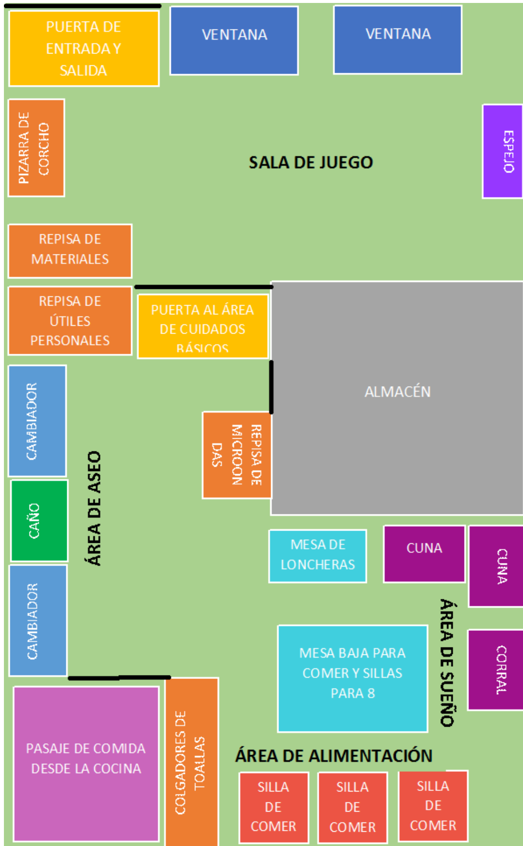
Figura N° 10. Croquis del aula.