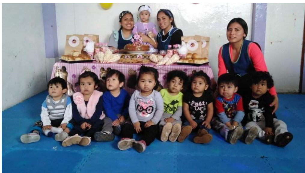
Figura N °6. Niños y niñas, docentes y auxiliar del aula Lila.

En cuanto a su conducta en los momentos de los cuidados básicos y atención a sus necesidades, en el momento de alimentación, son 8 los niños y niñas que comen sentados en una silla, sin barandas y los 5 restantes, en sillas de comer para bebés. La mayoría de niños y niñas comen por sí solos, haciendo uso de sus manos, solo 3 hacen uso de la cuchara (siempre y cuando un adulto les acerque su plato) y casi todos cogen sus botellas de agua (biberones o tomatodo) para beber; en general, se muestran tranquilos y concentrados en disfrutar de sus alimentos y no muestran señales de querer pararse, solo hasta que terminan de comer y desean ser limpiados; 4 pequeños toman 1 biberón al día. En cuanto al momento de aseo, todos disfrutan de sentir el agua en sus manos y rostros; la mitad del grupo extiende sus manos para mojarlas y al sentir el jabón en ellas, las frotan casi todos, cuando observan la toalla, extienden sus manos y las mueven para secarlas. Con respecto al cambio de pañal, todo el grupo muestra tranquilidad al momento de cambiarlos; la mayoría se cambia echado y realizan los movimientos que les vamos anticipando. En cuanto al momento de cambio de ropa, todos muestran tranquilidad al ser cambiados y colaboran, siguiendo las indicaciones o moviendo su cuerpo, en respuesta a los pedidos que van ejerciendo las profesoras.