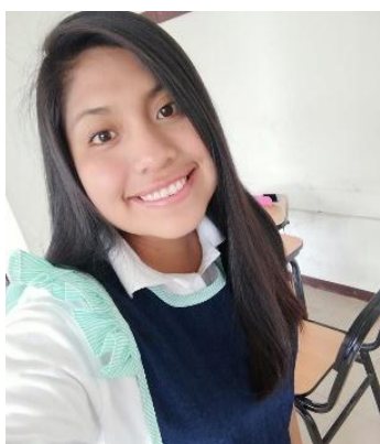
Figura N° 5. Docente practicante.

Mantiene una comunicación asertiva con su pareja de práctica, auxiliares, los padres de familia y directora de la institución educativa. Consulta las dudas que tiene, muestra apertura a las sugerencias de la asesora y las pone en práctica. Coordina permanentemente el trabajo con su pareja de práctica y con sus compañeras de la institución educativa.