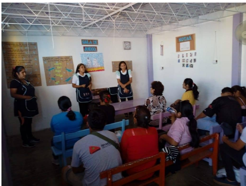
“Exploro con papá o mamá”