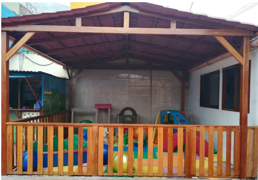
Figura N°7. Patio de juegos de cuna.

Las aulas de cuna cuentan con un área de recreación al aire libre, el cual es un patio techado con materiales estructurados que promueven el movimiento y desarrollo motor.