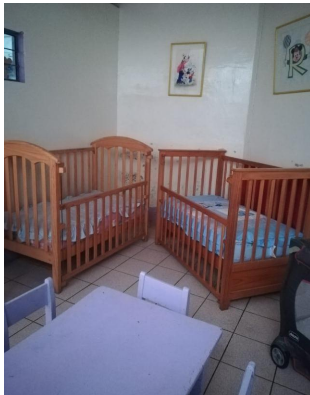
Figura N°9. Área de sueño.