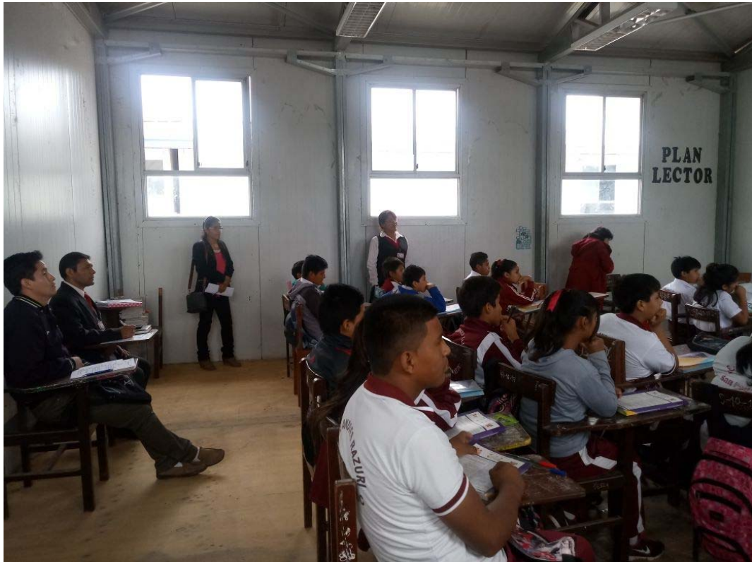
Subdirector monitoreando una sesión de aprendizaje de Comprensión de Textos con estudiantes de 2° año de secundaria de la I.E. “José Andrés Rázuri” San Pedro de Lloc.