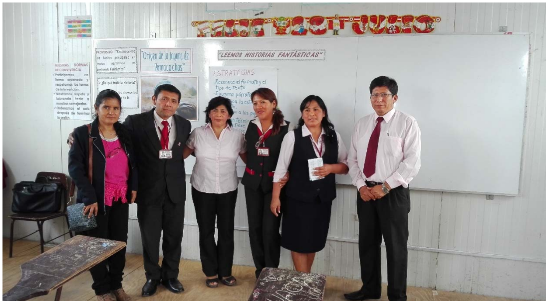
Subdirector con docentes al final de la sesión de aprendizaje de Comprensión de Textos con estudiantes de 2° año de secundaria de la I.E. “José Andrés Rázuri” San Pedro de Lloc.