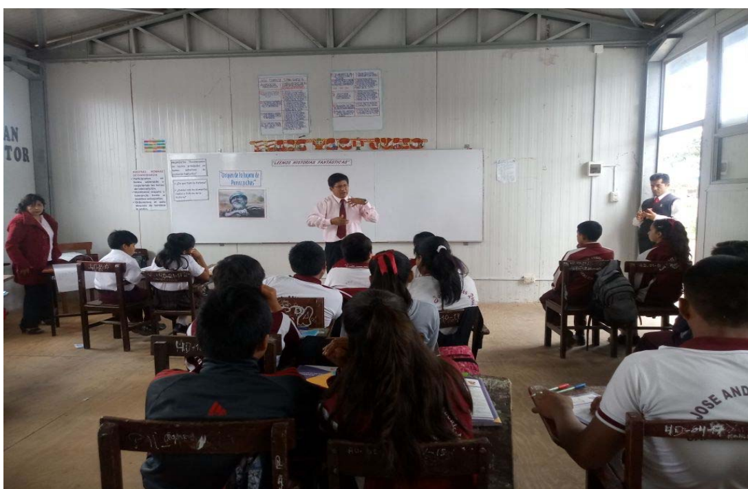
Docente de Comunicación desarrollando una sesión de aprendizaje de Comprensión de Textos con estudiantes de 2° año de secundaria de la I.E. “José Andrés Rázuri” San Pedro de LLoc.