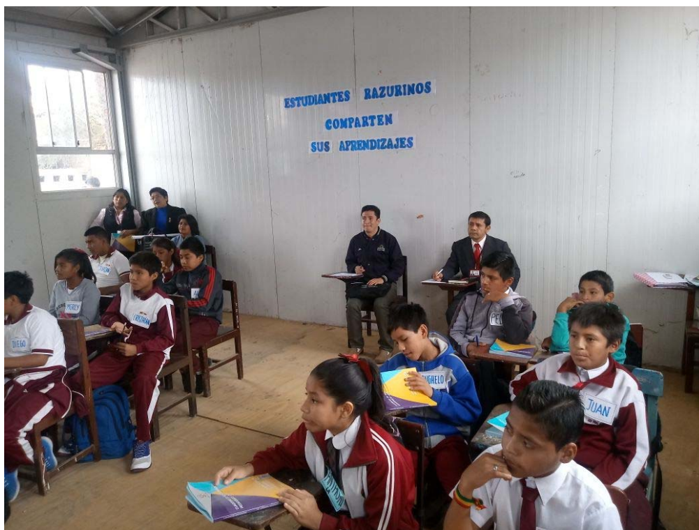
Subdirector observando una sesión de aprendizaje de Comprensión de Textos con estudiantes de 2° año de secundaria de la I.E. “José Andrés Rázuri” San Pedro de LLoc.