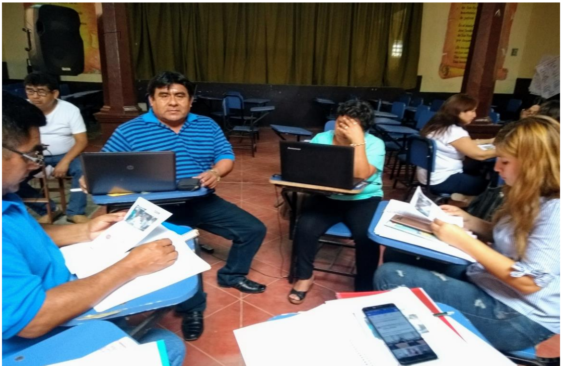
Subdirector participando del trabajo colaborativo entre docentes para mejorar la Práctica Docente en el Aula.