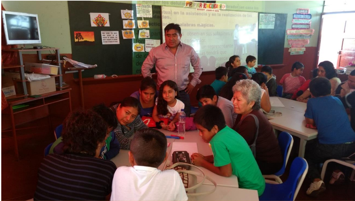
Subdirector interactuando con las Madres de Familia en las Jornadas Pedagógicas sobre convivencia en el aula, para la Mejora de los Aprendizajes.