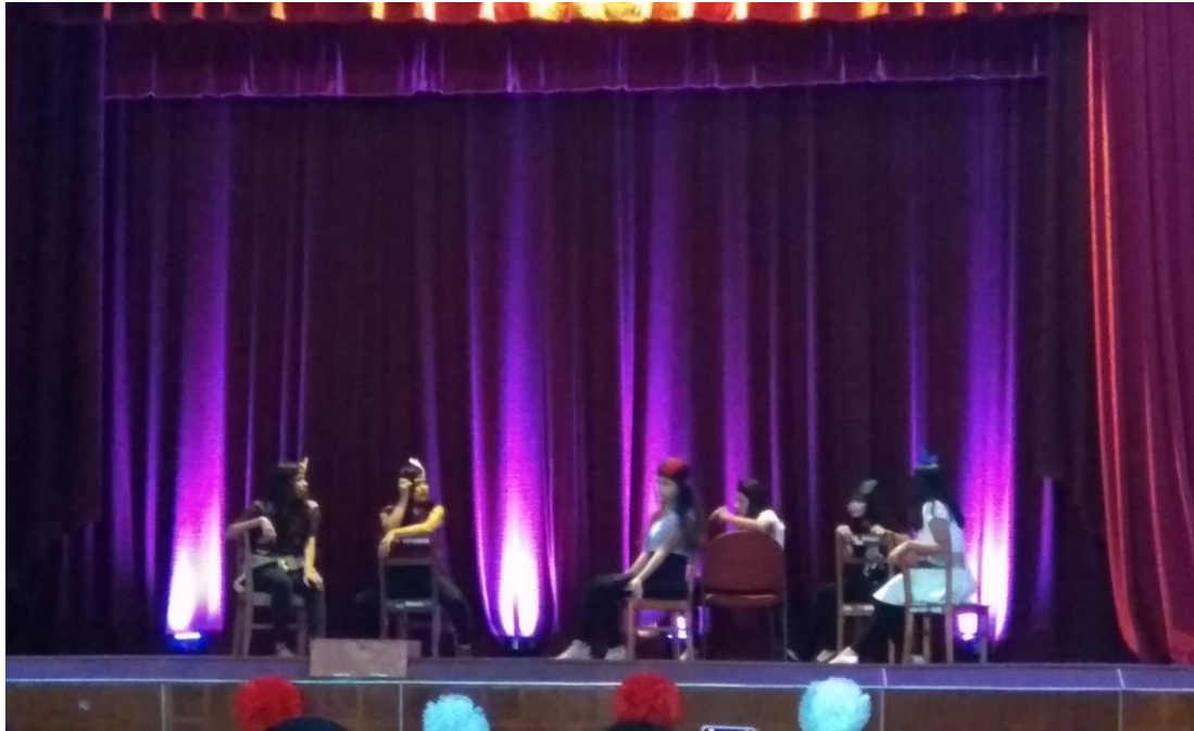
Figura 5. Fotografía de la representación teatral "Cabaret, el musical" por los estudiantes de la I. E. José Antonio Encinas Franco (centro de prácticas), dirigido por estudiantes practicantes de 5to año y como parte de la Tarde cultural del IPNM en el mes de agosto.

El Instituto Pedagógico Nacional Monterrico, inspirado en el carisma de la Sociedad del Sagrado Corazón, fundamenta su orientación pedagógica en 3 aspectos primordiales: “Valoración de la Persona”, que comprende la labor fundamental del docente de atender y acompañar al estudiante en su desarrollo personal y reconocer la dignidad humana; “Trabajo en comunión”, que integra una visión colectiva de la educación, resaltando la importancia y la necesidad del trabajo en equipo; y “Servicio y Compromiso social”, que responde a la vocación docente y el compromiso con la mejora del país.