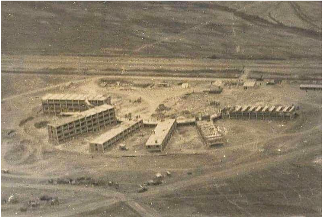
Figura 3. Fotografía del Instituto Pedagógico Nacional Monterrico durante su construcción.