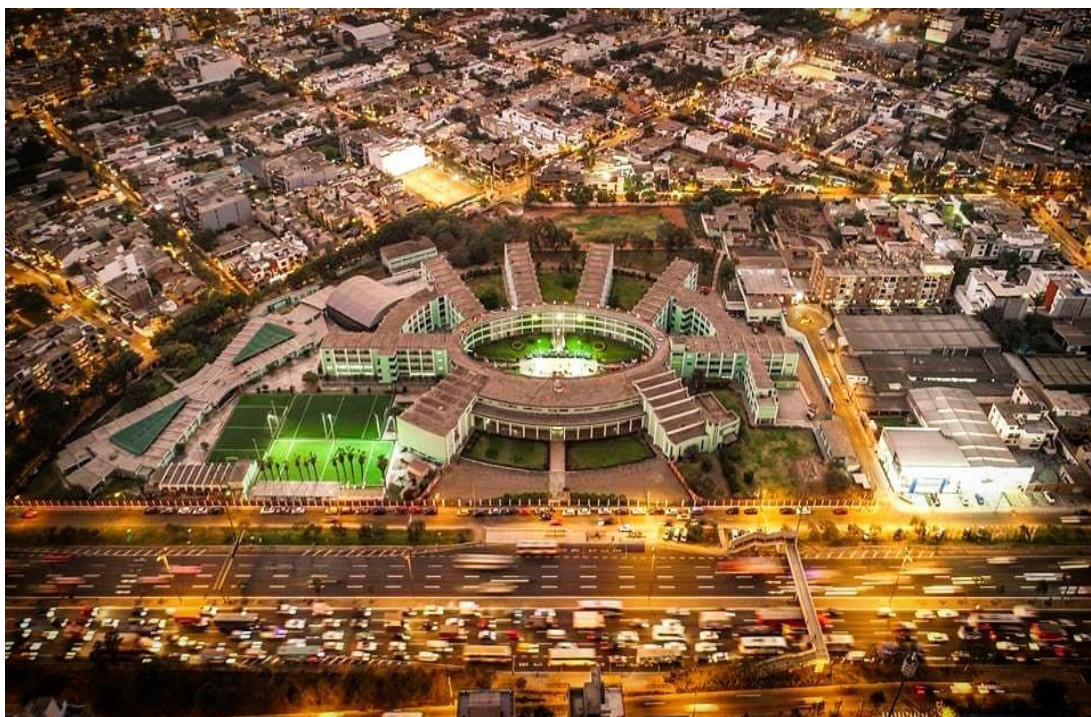
Figura 4. Fotografía del Instituto Pedagógico Nacional Monterrico en la actualidad.

La mencionada casa de estudios está a cargo de la Congregación de las Religiosas del Sagrado Corazón de Jesús, de acuerdo a un convenio con el Ministerio de Educación ratificado mediante la Resolución Ministerial N°1235-84-ED. Además, se rige bajo la Constitución Política del Perú; la Ley N°30220, Ley Universitaria; la Ley N°28044, Ley General de Educación; la Ley N°29364, Ley de Institutos y Escuelas de Educación Superior y la Ley N°28740, Ley del Sistema Nacional de Evaluación, Acreditación y Certificación de la Calidad Educativa, principalmente.