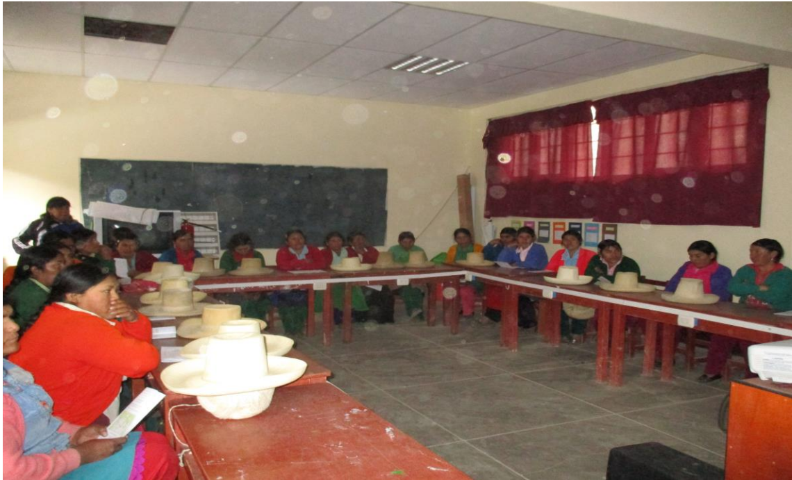
Trabajo con padres de familia para fortalecer el apoyo del trabajo pedagógico y así mejorar la comprensión lectora