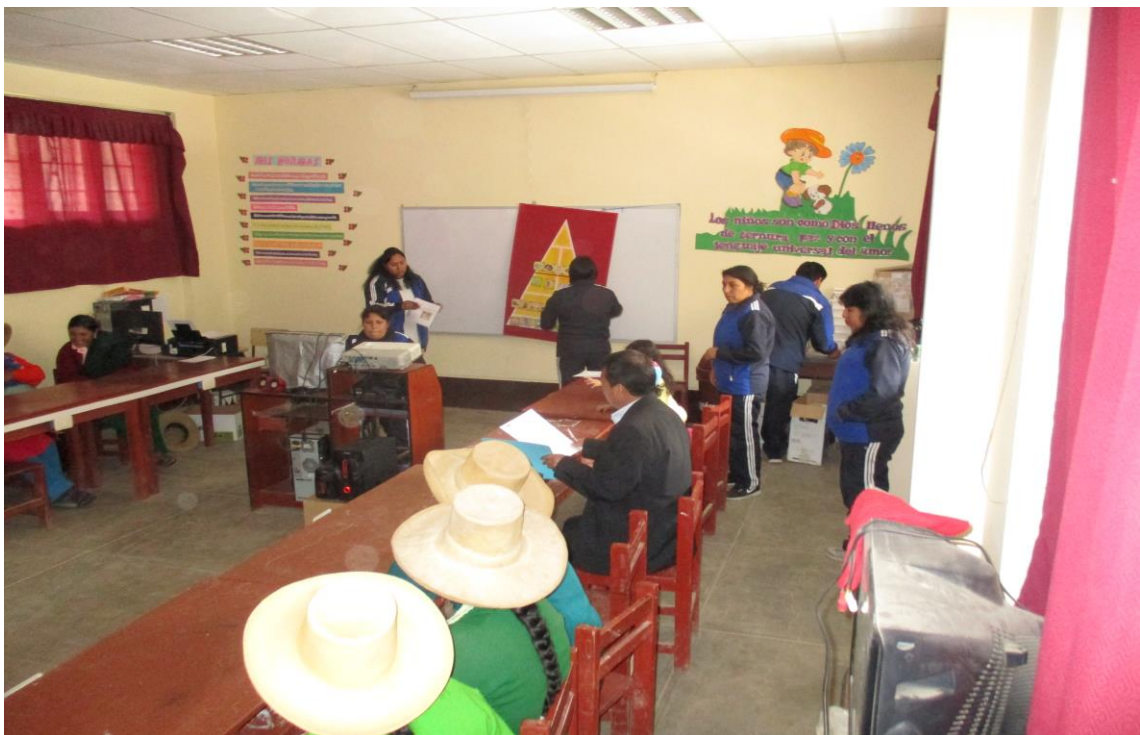
Jornada de trabajo con docentes y padres de familia para organizar el plan de Monitoreo, acompañamiento y evaluación de desempeño docente.