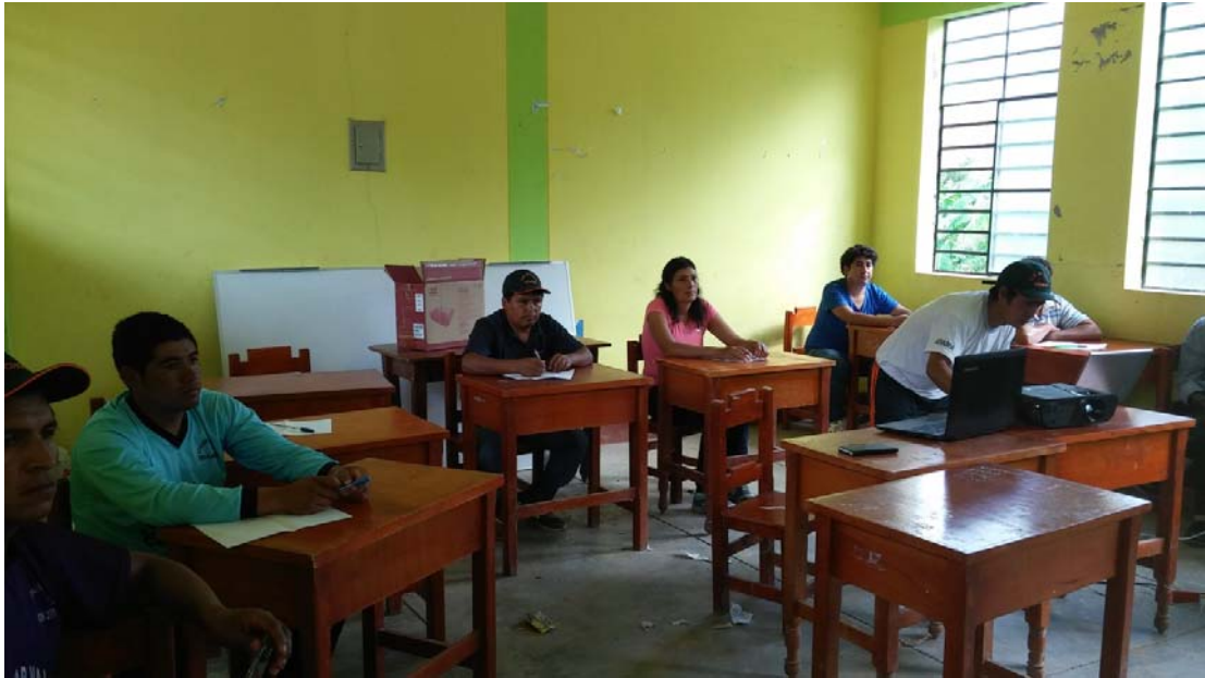
Reunión colegiada con los docentes de los tres niveles educativos de la I.E. Uchos