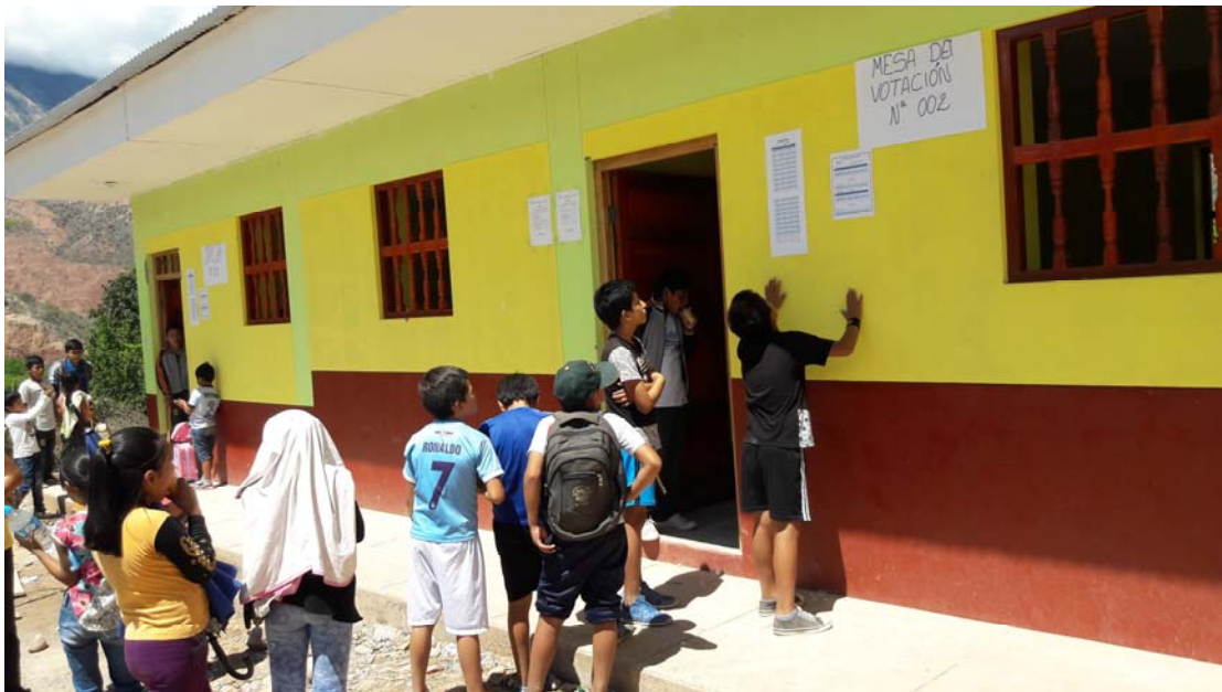
Cumpliendo con las elecciones democráticas del Alcalde Escolar 2017 en la I.E. Uchos