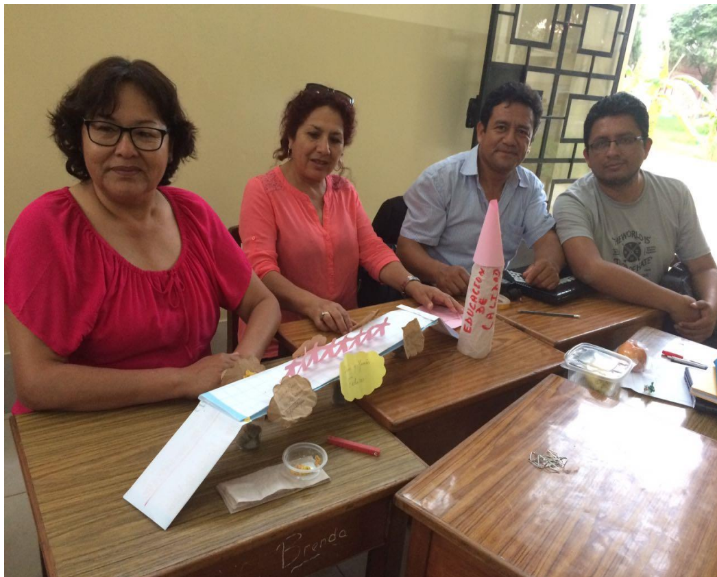
MUY FELICES PRESENTANDO NUESTRO TRABAJO EN GRUPO AULA 05