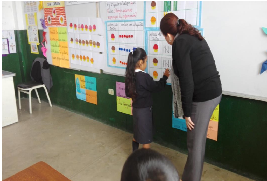
Monitoreo de una sesión de aprendizaje en el aula del segundo grado TEMA: GRAFICOS ESTADISTICOS