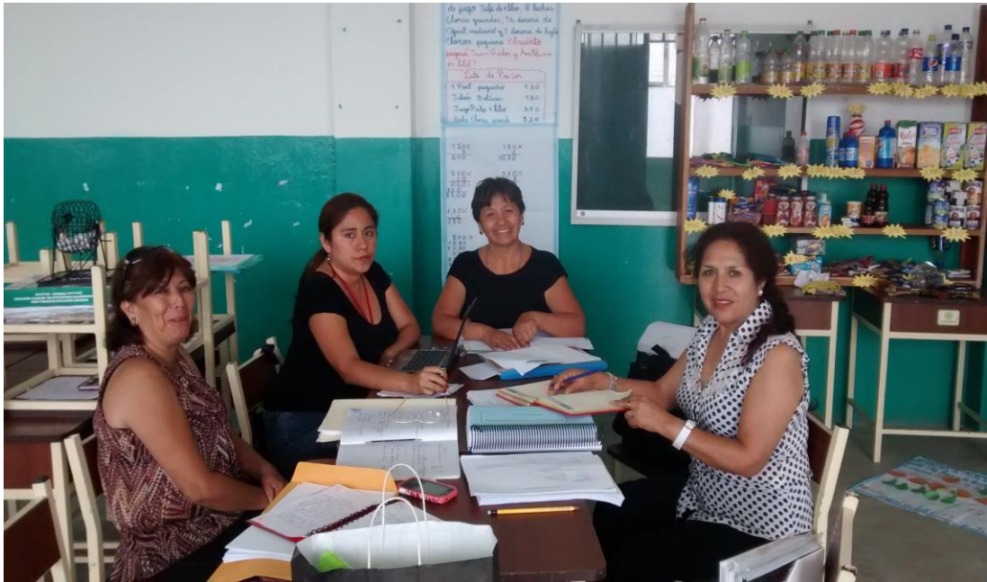
Jornada de reflexión con las docentes de la I.E. N° 82068