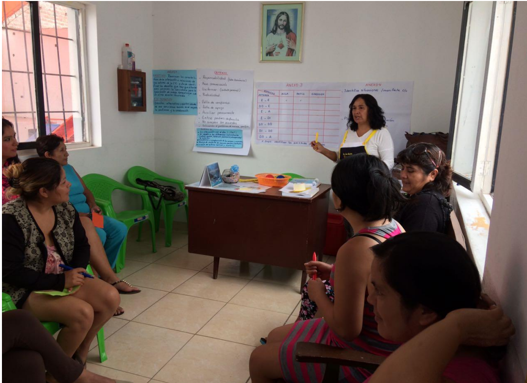
Directora con madres de familia en el taller de convivencia