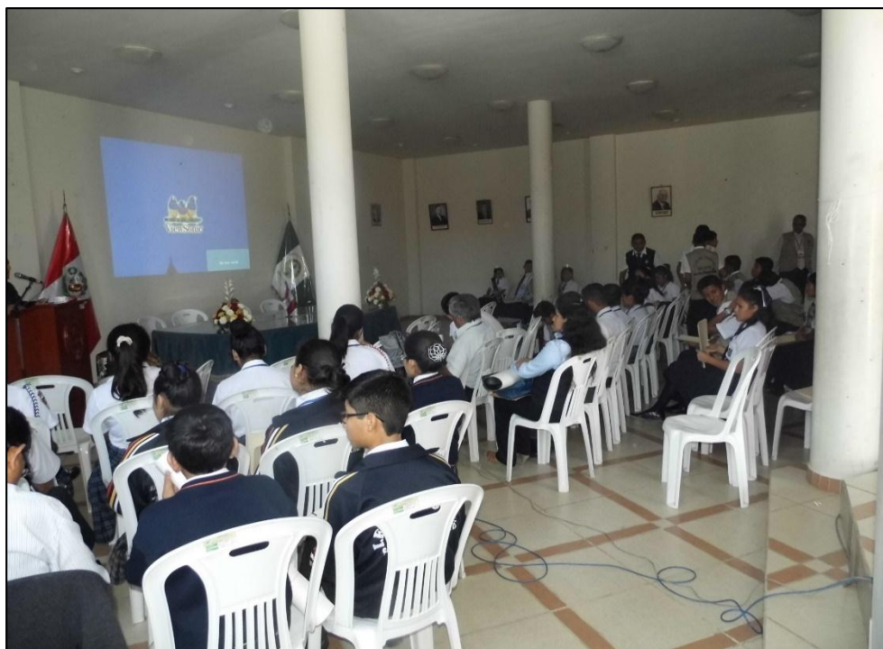
Talleres de Estrategias para favorecer el clima en el desarrollo de las sesiones de aprendizaje a los estudiantes de la I.E. “Jequetepeque” - Pacasmayo.