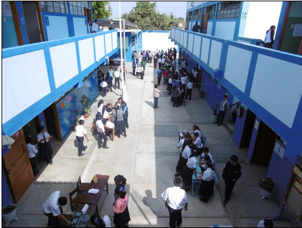
Vista de la I.E. "Jequetepeque" – Pacasmayo, durante la celebración del "Día del Logro" - 2017