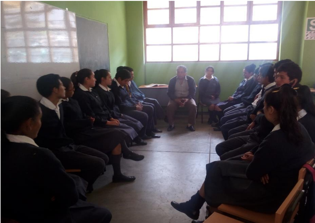
Directivo en reunión con estudiantes, conjuntamente con la docente del área de comunicación analizando el avance del aprendizaje sobre comprensión de textos escritos.