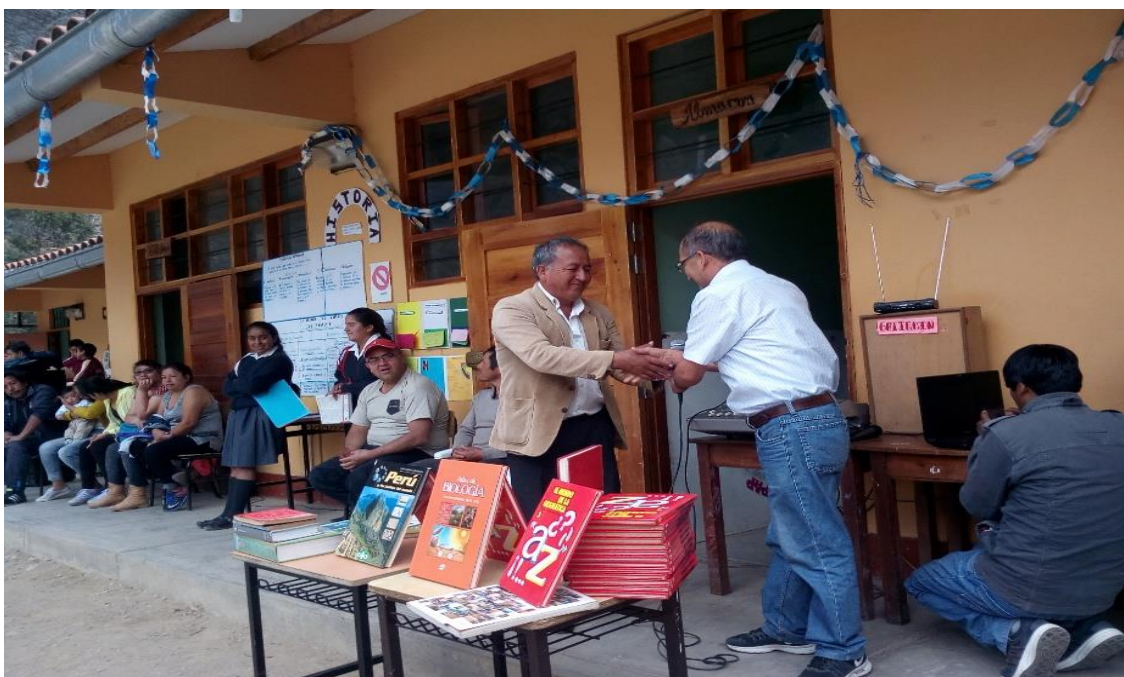
Directivo recibiendo la donación de libros por parte de un profesional de la salud interesado en la mejora de la comprensión lectora de todos los estudiantes.