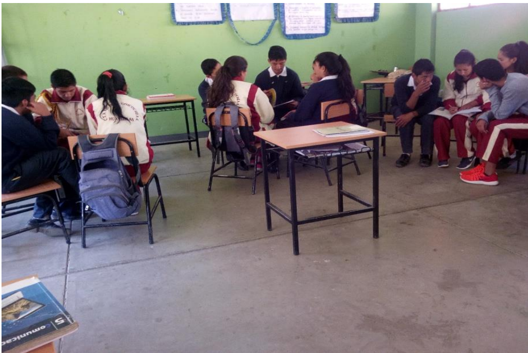
Estudiantes del quinto grado de Educación Básica Regular aplicando las estrategias aprendidas para la comprensión de textos escritos.