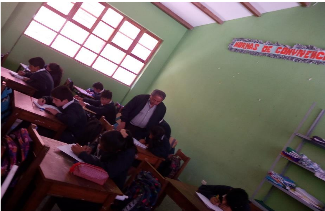
Directivo supervisando y orientando a los estudiantes del segundo grado de Educación Básica Regular durante el desarrollo de su sesión de aprendizaje relacionado a la comprensión de textos escritos.