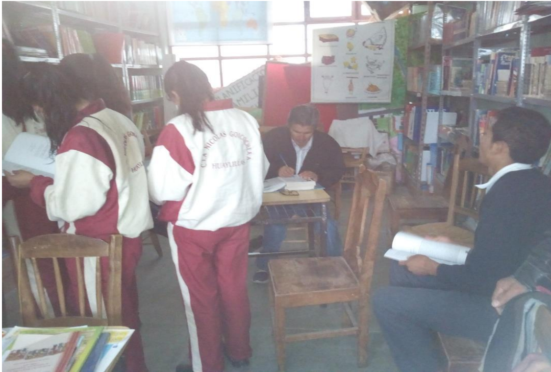
Estudiantes de la institución educativa utilizando los textos de la biblioteca escolar, durante la práctica del Plan Lector, bajo la observación e indicaciones del docente.