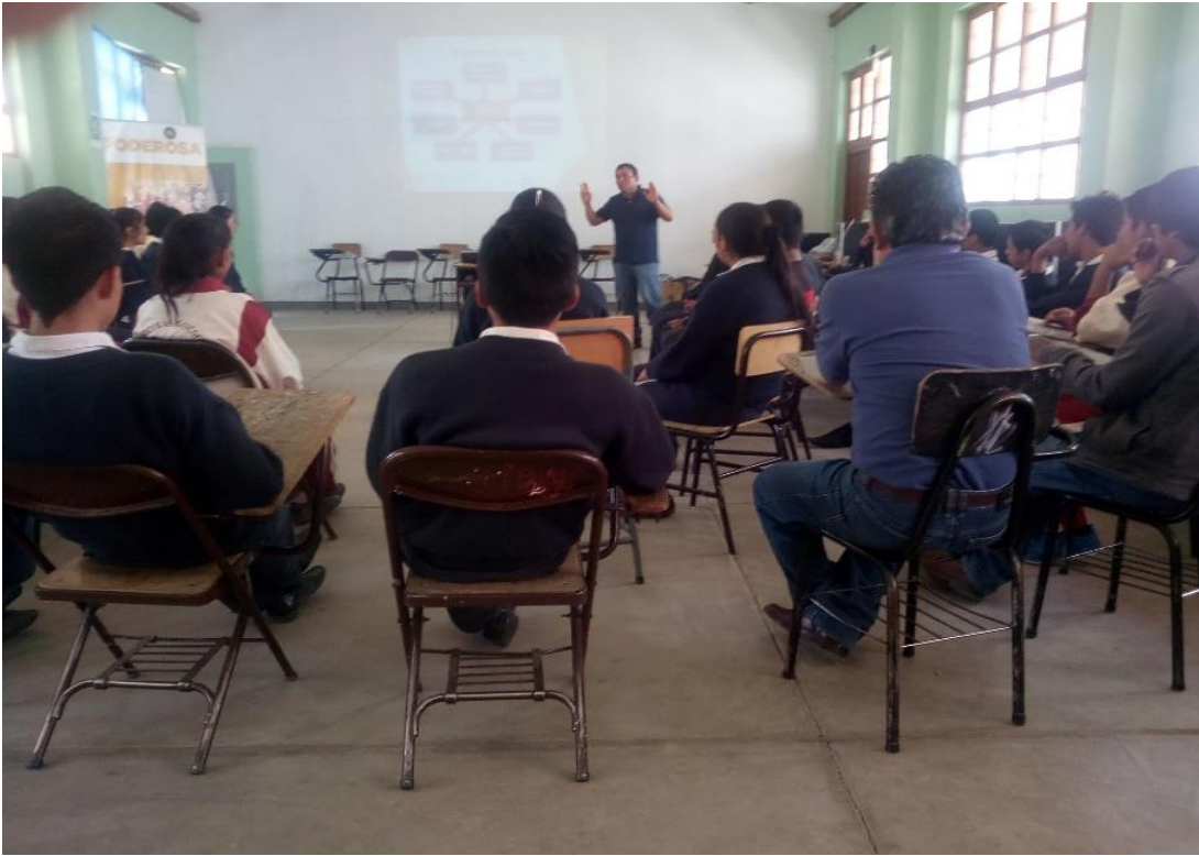
Estudiantes y docentes de comunicación recibiendo orientaciones sobre estrategias para la mejor comprensión de textos escritos.