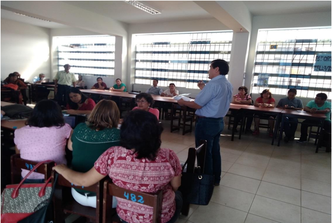
Socializando el Plan de Monitoreo y acompañamiento con la participación de los docentes