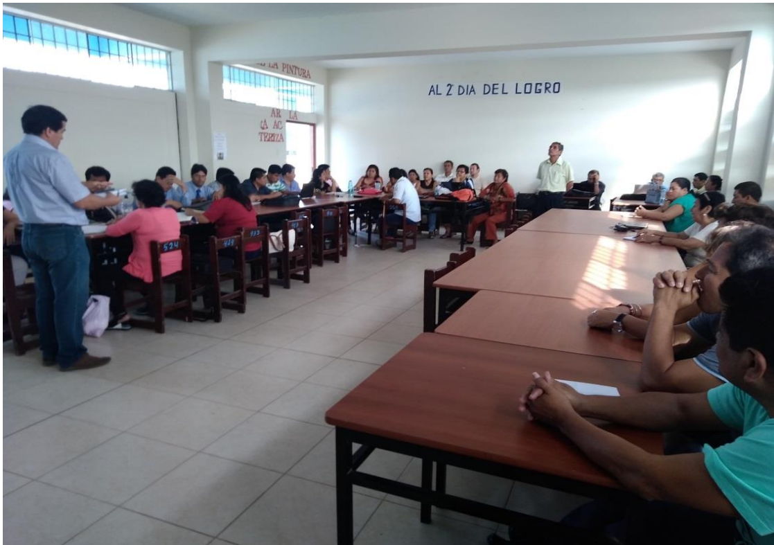
Directivo y docentes reflexionando sobre la práctica pedagógica