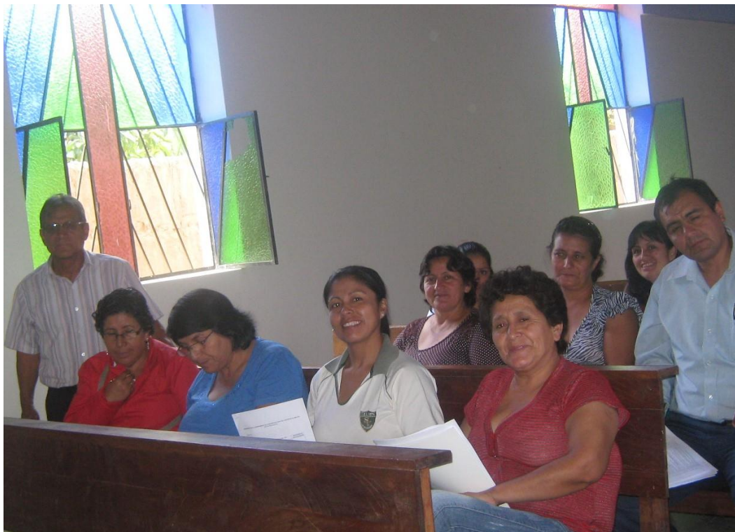
Socializando con docentes la ficha de monitoreo de la sesión de aprendizaje