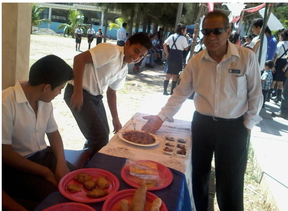
Directivo al lado de estudiantes que están demostrando sus logros de aprendizaje con insumos del contexto, integrando competencias de área.