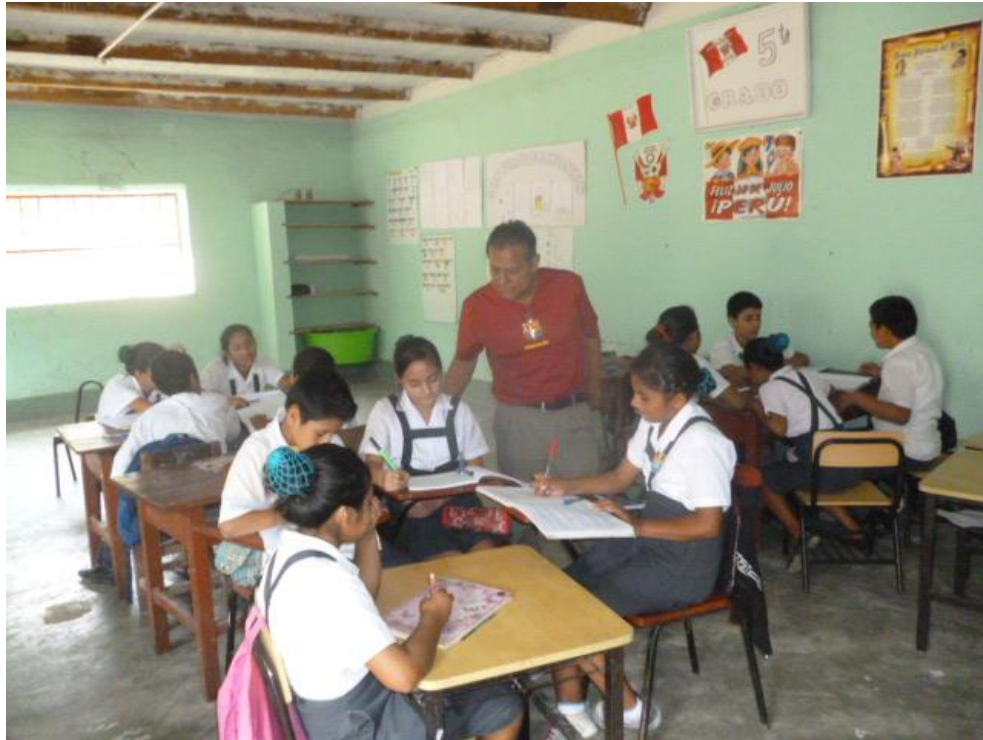
Monitoreando el trabajo en equipo que realizan estudiantes del VI ciclo en al área de Matemática