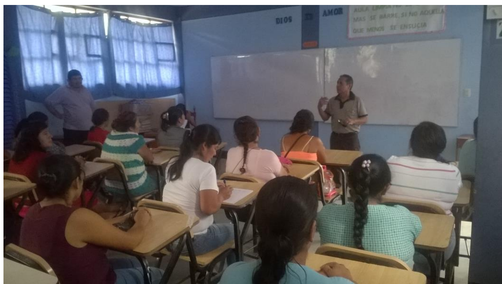
Directivo realizando tarea de sensibilización a padres de familia sobre la importancia de participar en el proceso de aprendizaje de los estudiantes.