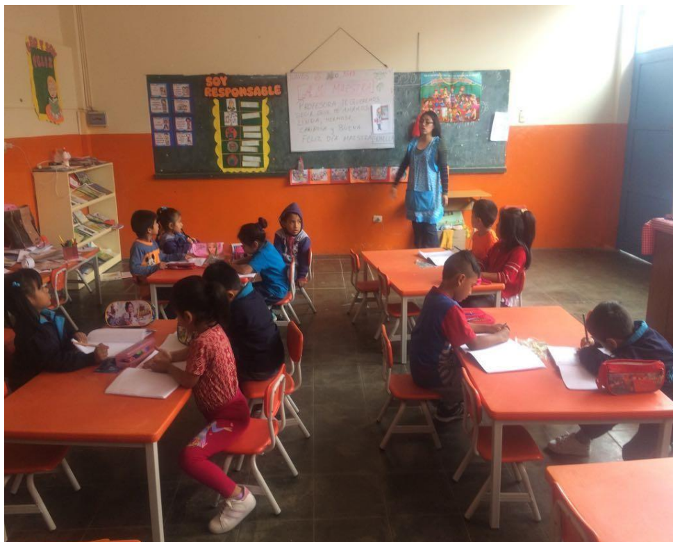
Docentes del aula de 5 años de la IE. "Tupac Amaru", realizando estrategias tradicionales en el área de comunicación.