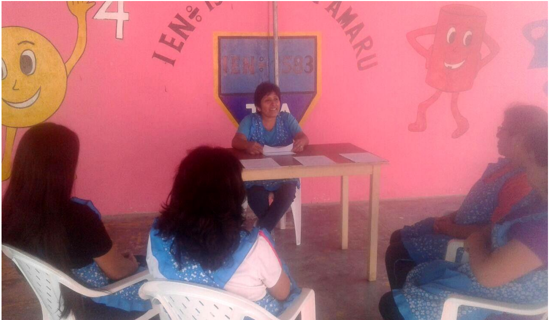
Docentes de la IE, "Tupac Amaru" participando de la entrevista FOCUS GROUP, aplicado como Instrumento de diagnóstico