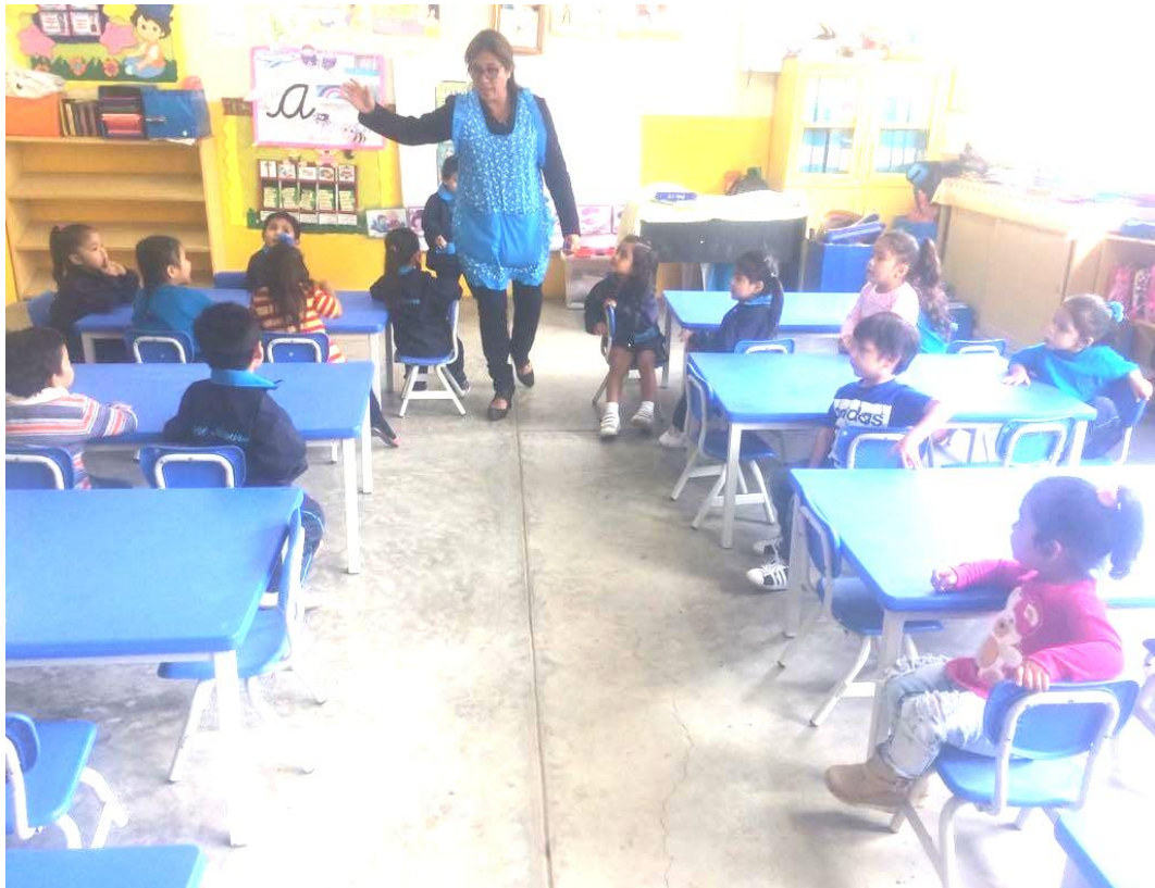
Docentes del aula de 3 años de la IE. "Tupac Amaru" realizando estrategias tradicionales en el área de comunicación.