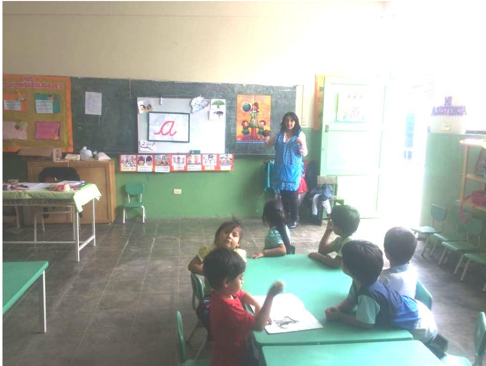
Docentes del aula de 4 años de la IE. "Tupac Amaru" realizando estrategias tradicionales el área de comunicación.