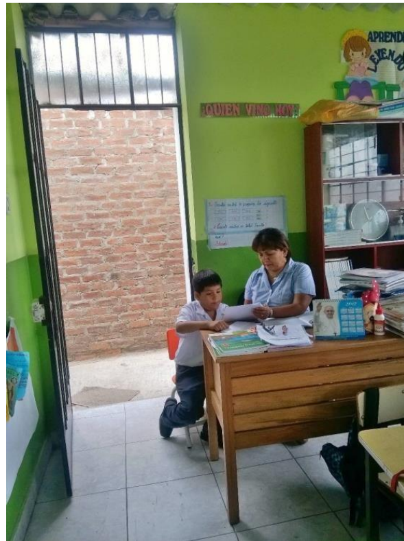
Alumno del cuarto grado de primaria respondiendo a las preguntas del grupo focal relacionado con la comprensión lectora.