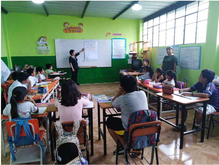
Directivo realizando monitoreo en el aula del IV ciclo en una sesión de comprensión lectora.