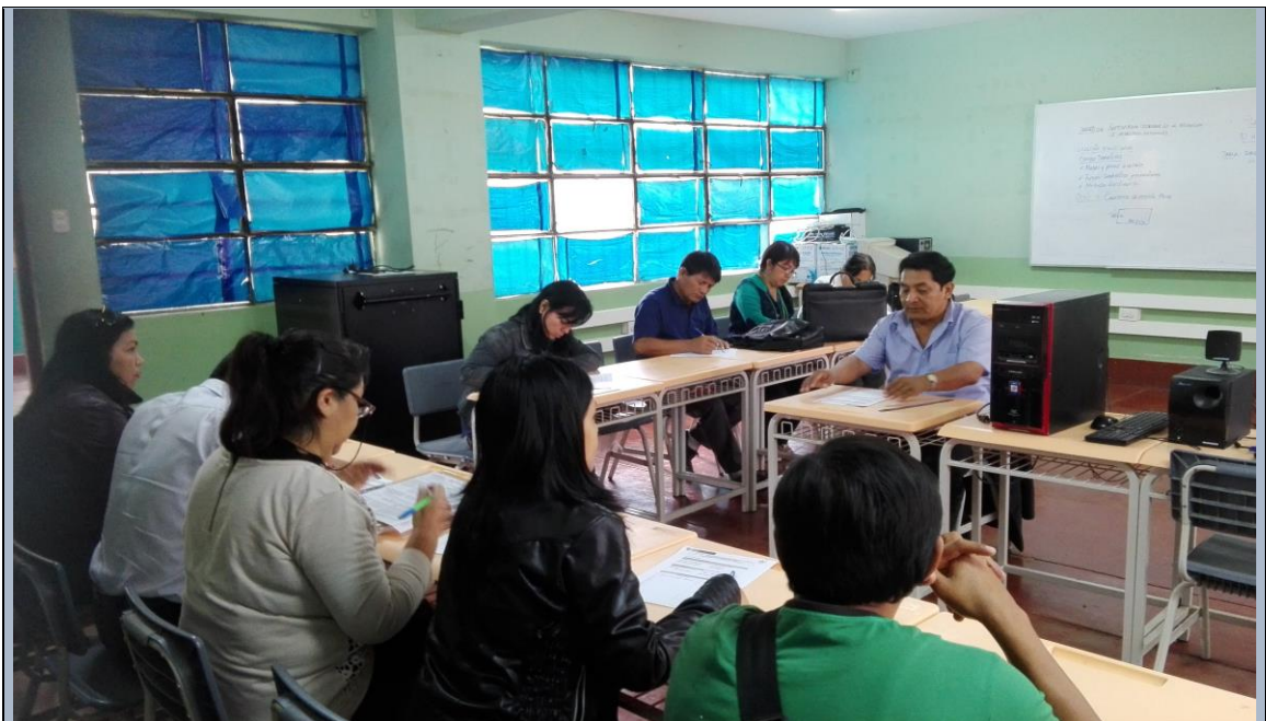
Trabajo con los Docentes sobre la implementación del Plan de Acción sobre Monitoreo, Acompañamiento y Evaluación Docente en la I.E N° 89 “Albújar y Guarniz”.