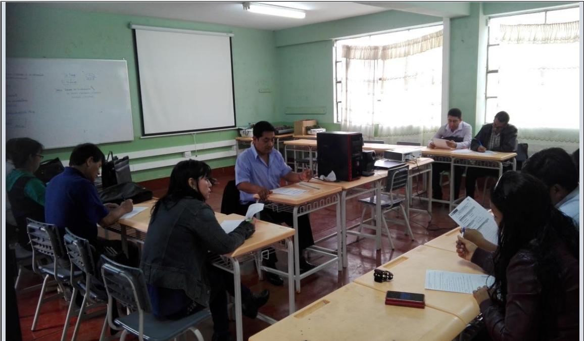
Elaborando el Diagnóstico situacional para el Plan de Acción, con los Docentes del área de comunicación en la I.E. N° 89 “Albújar y Guarniz”.