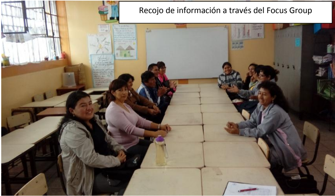
Recojo de información a través del Focus Group