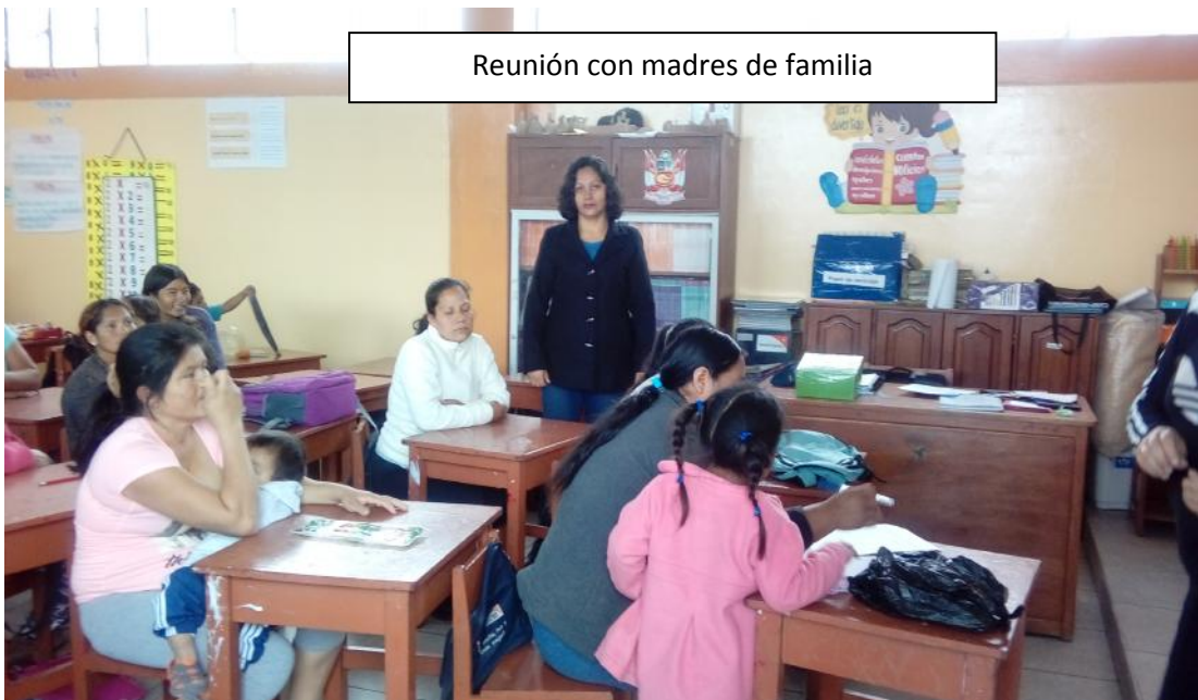
Reunión con madres de familia