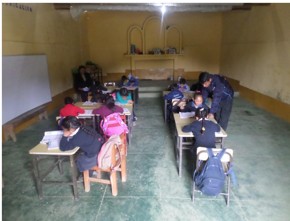
Realizando el monitoreando en el aula al docente del 1° grado en el área de matemática