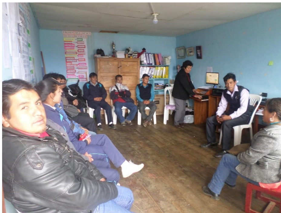
Realizando el taller de capacitación sobre el Curricular Nacional a todos los docentes de la I.E.80436