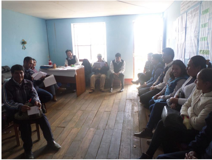
Se evidencia la reunión colegiada con todo el docente de la I.E. 80436 donde con la participación activa de todos, se está elaborando el plan de monitoreo para el año 2018 sobre la convivencia escolar