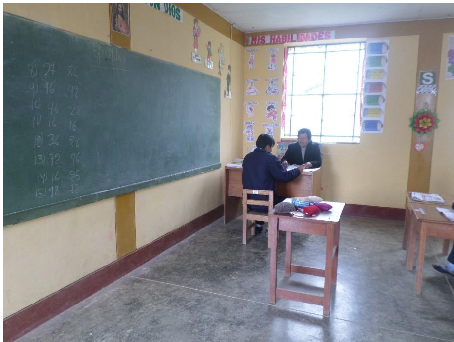
Realización del asesoramiento personalizado en espacios programados fuera del horario de clase al docente del 2° grado en el área de matemática en la I.E. 80436.